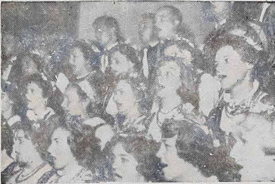
Os descendentes de poloneses sempre cultivaram os seus conjuntos folclóricos lembrando as canções e danças polonesas.