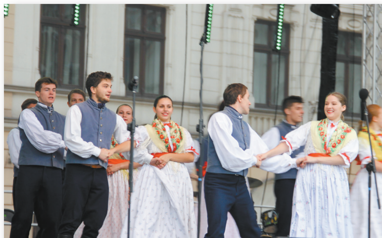
• Zespół „Suszanie”.