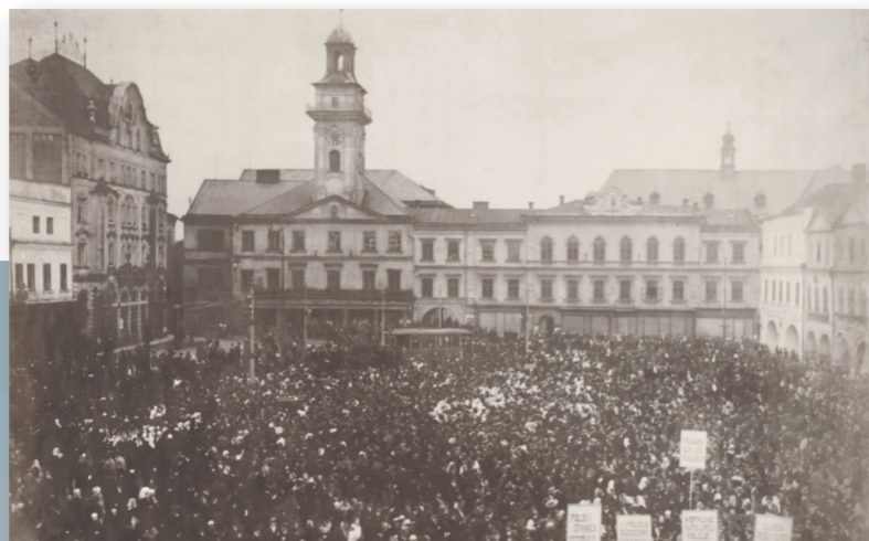
• Historyczny wiec w Cieszynie, 27 października 1918 roku.