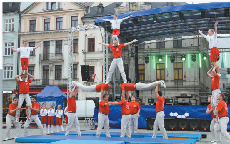
• Próbkę umiejętności dali wędryńscy „Gimnaści”.