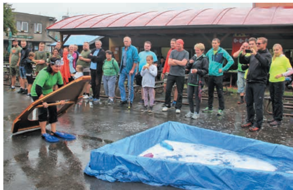
• Zawodnicy walczyli na łódce, w powietrzu i wodzie.