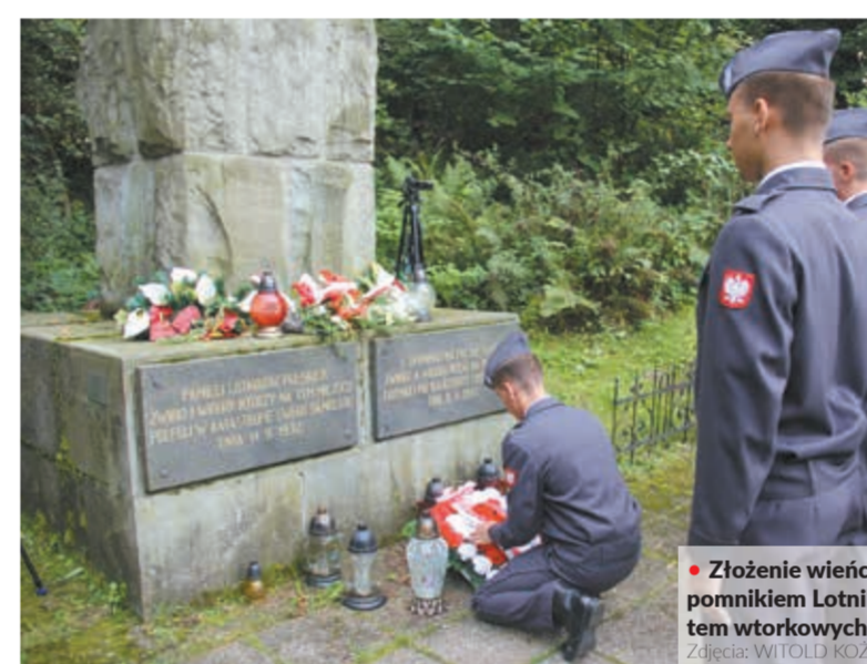
• Złożenie wieńców i kwiatów pod pomnikiem Lotnika było głównym punktem wtorkowych uroczystości.

Z kolei dziś na Kościele odbędzie się Młode Żwirkowisko.