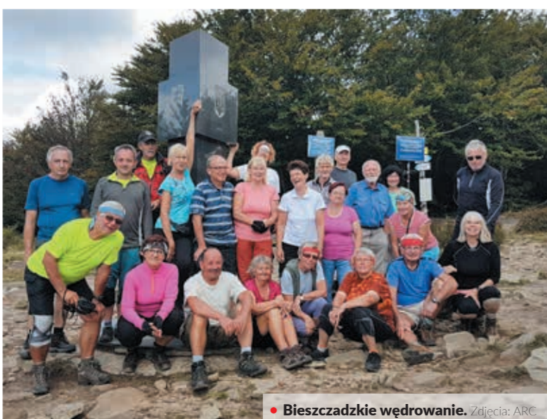
• Bieszczadzkie wędrowanie.

Drotarie”. W maju wyjechalśmy zapoznać się bliżej z historią Polski i przejść następny odcinek Szlaku Orlich Gniazd. Z kolei w czerwcu wyjechalśmy nie tylko na góry, ale też zwiedzić ciekawe tereny pod ziemią – odwiedziliśmy uroczyste Morawski Kras. W sierpniu mała