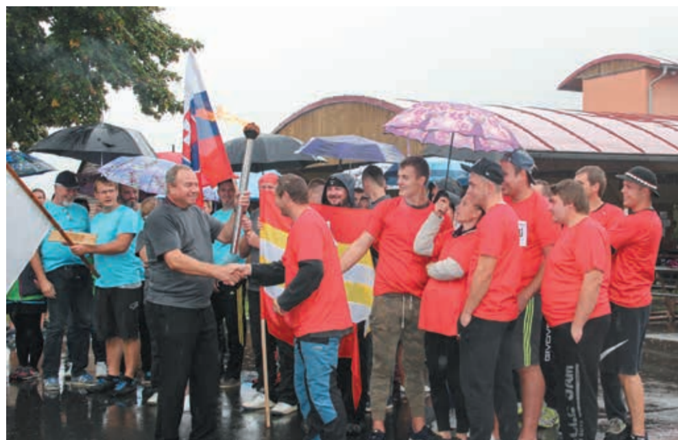
• Ogień olimpijski przekazały sobie kolejno wszystkie drużyny.

Zwycięstwem gospodarzy zakończyła się sobotnia olimpiada gmin partnerskich w Wędrzynie. W imprezie wzięło udział dziesięć drużyn z Republiki Czeskiej, Polski i Słowacji. Swoje reprezentacje wystawiły Bystrzyca, Gródek, Nydek, Milików, Herczawa, polskie Kozakowice i Godziszów, słowackie Leszczyny i Czerne oraz miejscowa Wędrzyna.