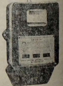
W drodze: — Liczniki elektryczne (medidores de luz), oraz węgiel do kin (carvão para cinema).

OTRZYMALIŚMY, BEZPOŚREDNIO Z POLSKI: Brony 36-cio talerzowe, marki "WISŁA", produkowanej przez Słupską Fabrykę Narzędzi Rolniczych. Cena Cl$ 105.000,00. Drut kolczasty oraz skobelki ocynkowane (grampos p/cérca) OCZEKUJEMY W LISTOPADZIE: Sadzonki ziemniaków, następujących gatunków: CAPELLA, WYSZOBORSKIE i FLISAK, w skrzynkach 30-to kilowych. UWAGA: — Ponieważ otrzymamy ograniczoną ilość, zainteresowani niech składają swoje zamówienia natychmiast.