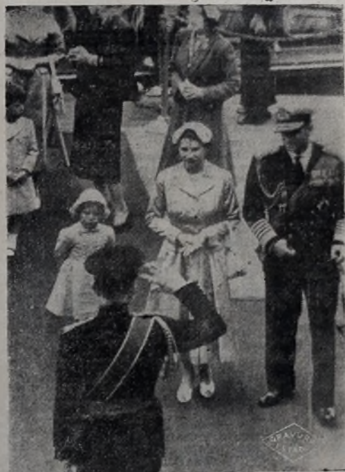
ANGIELSKA RODZINA KROLEWSKA wysiada na ląd w Westminster po 6-cio miesięcznej podróży. Księżniczka Anna z powagą i godnością przyjmuje honory oddane przez straż.

● 20 MAJA ODBYŁY SIĘ WYBORY na posłów w Południowej Korei. 8 milionów Koreańczyków, z których 20% jest analfabetów, walało sobie palce tuszem, aby pozostawić odbicie palców na fotografii posła, na którego głosują.