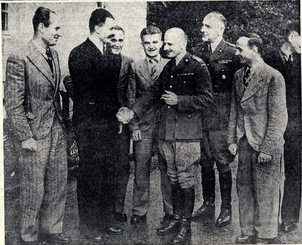
Gen. Marian Kukiel wita Polaków przybyłych świeżo do Szkocji po kilkumiesięcznej podróży

Kraju. FONDATION ARCHIVUM HELVETICO POLONICUM Basle - Chemin 27 CH-1202 Ecublens