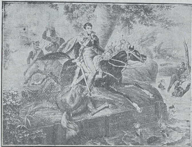
Mort du Prince Joseph Poniatowski, Maréchal de France, qui se noie dans l'Elster, en couvrant, près de Leipzig, la retraite de Napoléon (1813).