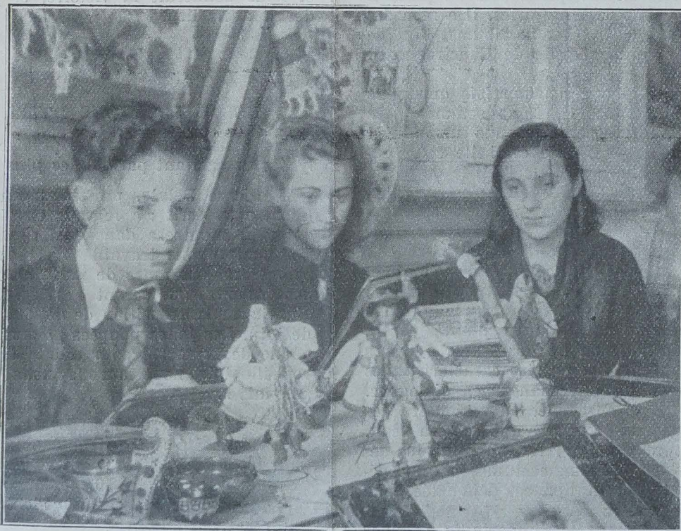
Les élèves d'un lycée français s'inspirent des belles couleurs et des gracieuses inventions de l'art populaire polonais.