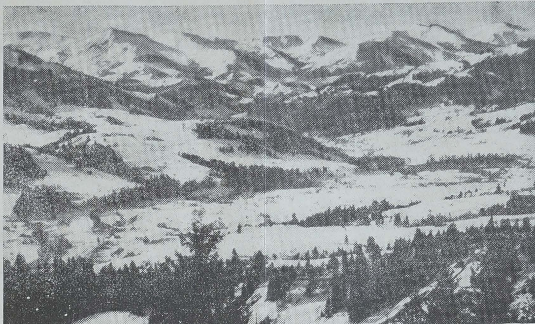
UN BEAU TERRAIN DE SKI DANS LES BESKIDES ORIENTALES EN POLOGNE