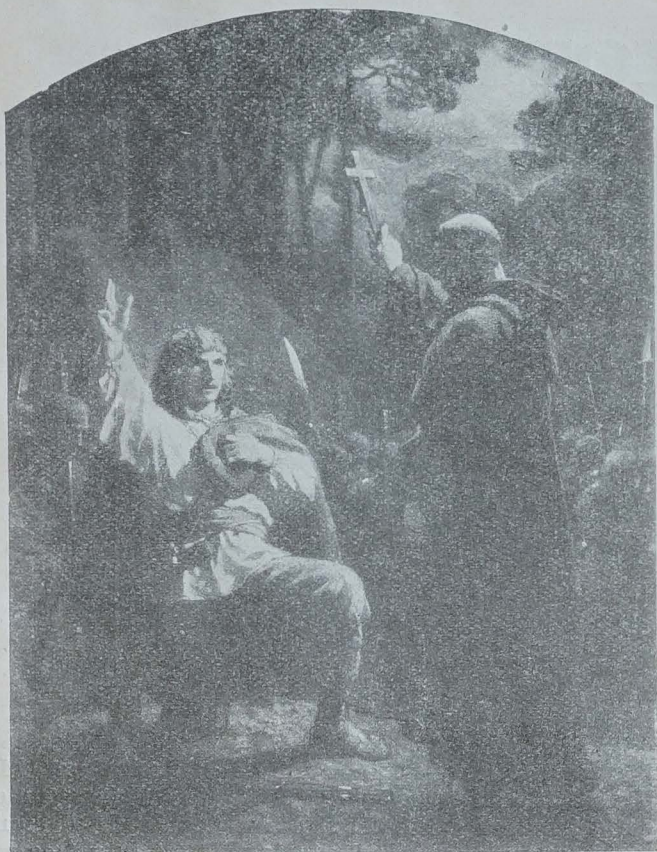
LA BÉNÉDICTION DE L'INSURGÉ

surprit et ravit à la fois si complètement Grottger, qu'il dit à ses amis : « Mon Dieu, pourrais-je recevoir une plus belle récompense que celle-là ? » Il composa encore « Varsovie II » ; mais ce deuxième cycle, errant d'exposition en exposition, finit par disparaître. On croit que quelqu'un l'acheta à Londres, mais jusqu'à aujourd'hui il n'a pas été retrouvé.