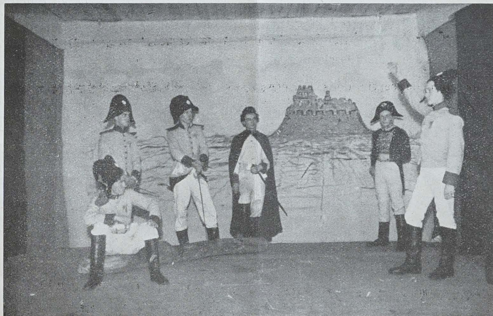
LES « LYS D'OR » AU LYCÉE GIZYCKI