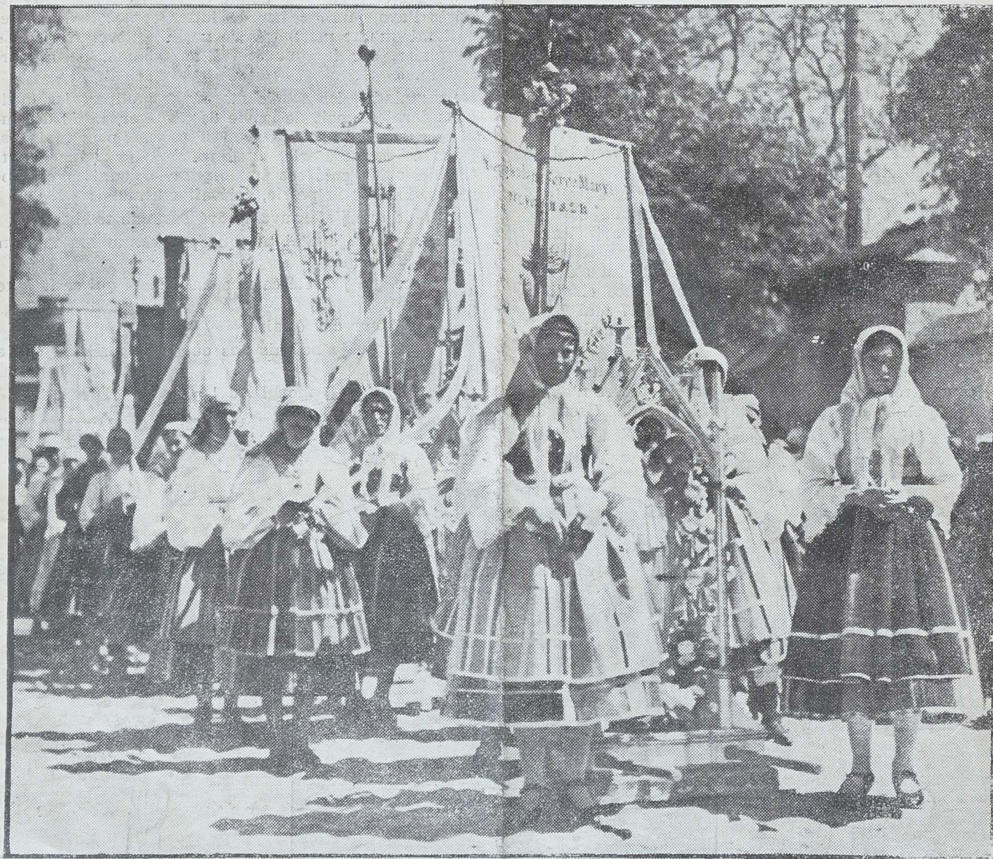
Procession de la Fête-Dieu à Lowicz