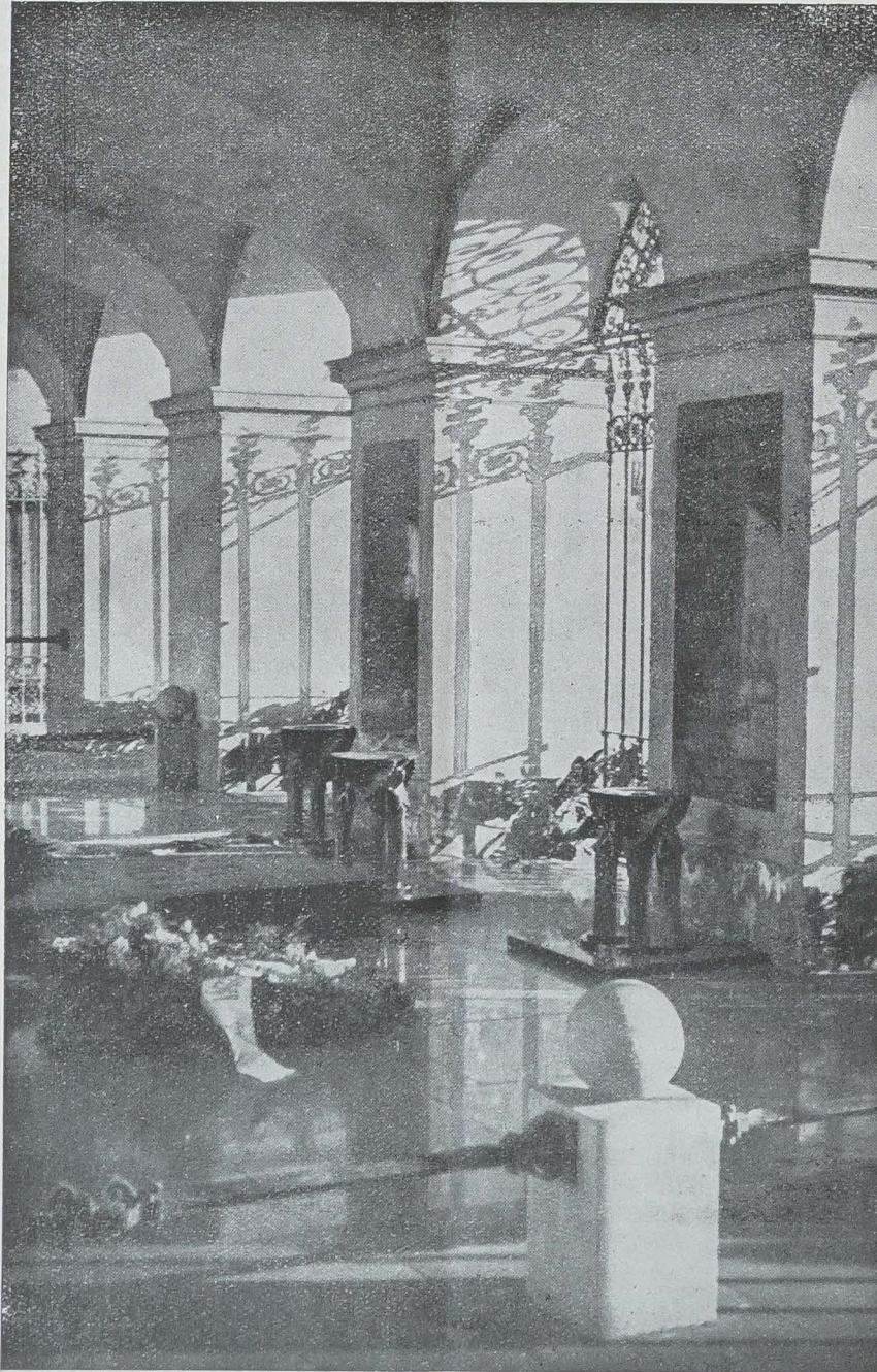
LE TOMBEAU DU SOLDAT INCONNU A VARSOVIE SOUS LES ARCADES DU JARDIN DE SAXE