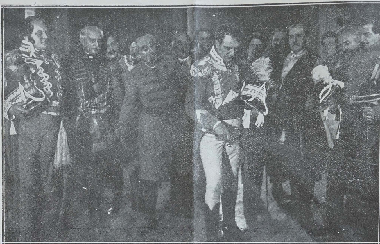
Une image d'un film polonais : « Monsieur Thadée », d'après le chef-d'œuvre de Mickiewicz : Les officiers polonais engagés dans les armées de Napoléon (à gauche le Général Dombrowski)