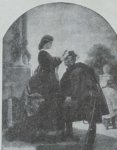
LE DÉPART DE L'INSURGÉ

En ce temps-là, il commençait seulement à dessiner ;