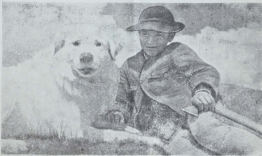
UN BERGER MONTAGNARD ET SON CHIEN