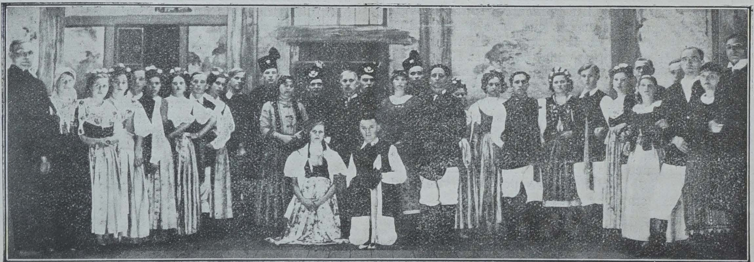
UN CERCLE THÉÂTRAL DES ÉMIGRÉS POLONAIS EN FRANCE

(NOTE DE LA RÉDACTION. — Ce récit nous a été adressé non en polonais, mais en français. Nous n'avons pas eu à le traduire. Nos lecteurs se rendront compte de la rapidité avec laquelle les ouvriers polonais en France peuvent s'assimiler notre langue.)