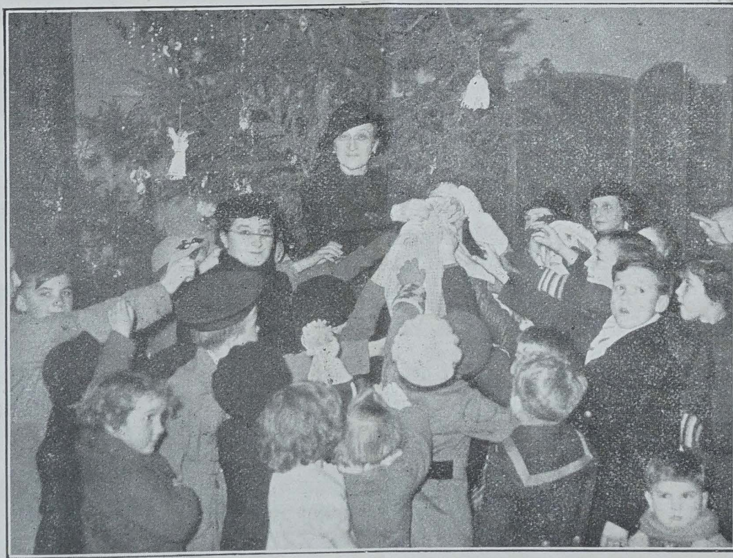
L'arbre de Noël des Enfants Polonais à Paris

Que toutes soient vivement remerciées pour leur joli geste, qui témoigne de tant de cœur.