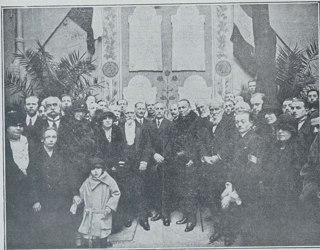
LE MARÉCHAL FOCH A L'ECOLE POLONAISE DES BATIGNOLLES

C'était un émigré de 1830. Il avait été sous-officier d'artillerie dans l'armée polonaise. A la bataille d'Ostroleka, il avait eu la mâchoire fracturée. Il lui en restait un mouvement de mâchonnement continu, mal dissimulé dans une grande barbe.