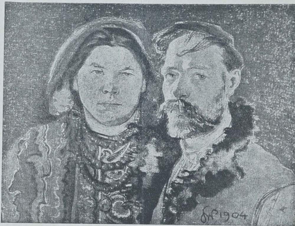
WYSPIAŃSKI ET SA FEMME, PAYSANNE DE CRACOVIE (Tableau de Wyspiański)