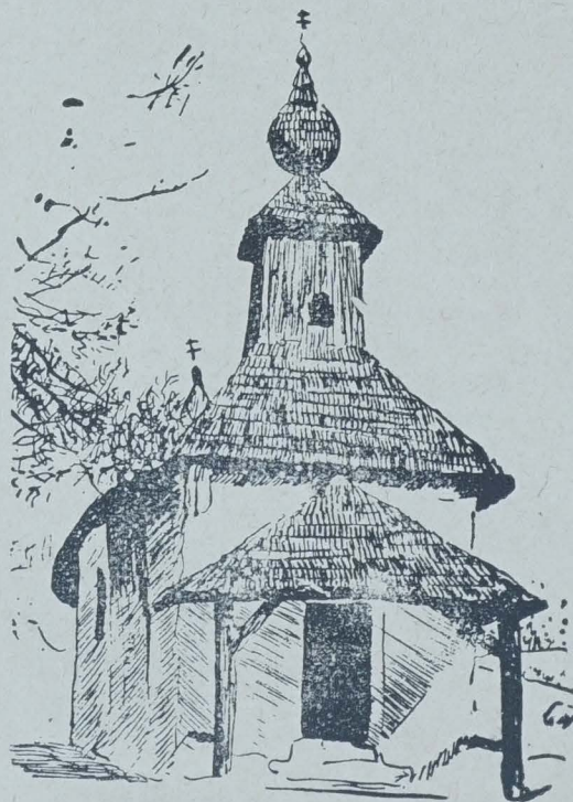
PETITE EGLISE EN BOIS

« D'où es-tu, femme ? » s'informe le Seigneur Jésus. Mais elle ne fait que pleurer et se lamenter. Elle dit qu'elle s'appelle Madeleine, qu'elle s'en va de par le monde chercher la mort, car les gens la chassent comme une chienne. Le Seigneur vit aussitôt qu'elle était une grande pécheresse : « Tu as beaucoup péché ! » lui dit-il. Alors elle le regarda seulement dans les yeux et aussitôt son cœur se contracta d'effroi, mais elle répondit : « J'ai péché, Seigneur ! » — « Ne pêche plus désormais, fais pénitence et ton péché te sera pardonné ». Et le Seigneur Jésus lui ordonna d'apporter de ses mains de petits