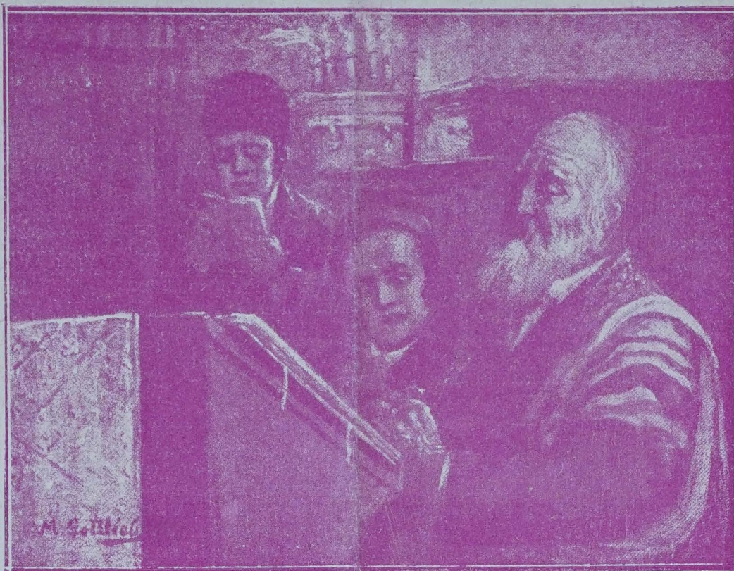
CHEZ LES JUIFS POLONAIS LA PRIÈRE (Tableau de Gottlieb)