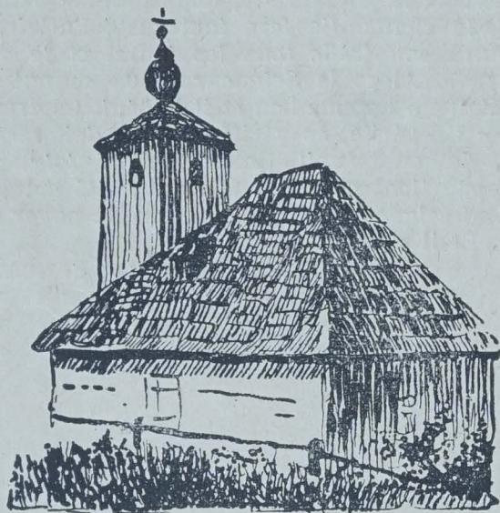
PETITE EGLISE EN BOIS

— Voilà comment ça s'est passé, me dit un des frères, comme nous descendions déjà du sommet. Les vieillards contaient, il y a bien trente ans de ça, que ça s'est