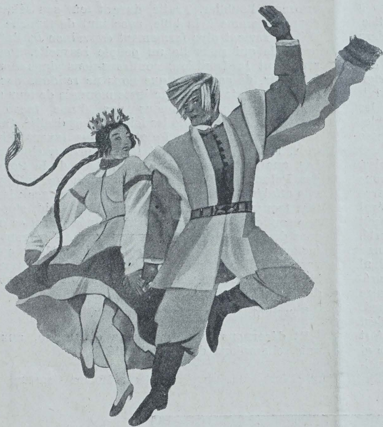
1927 MAZUR Z STRYIENSKA