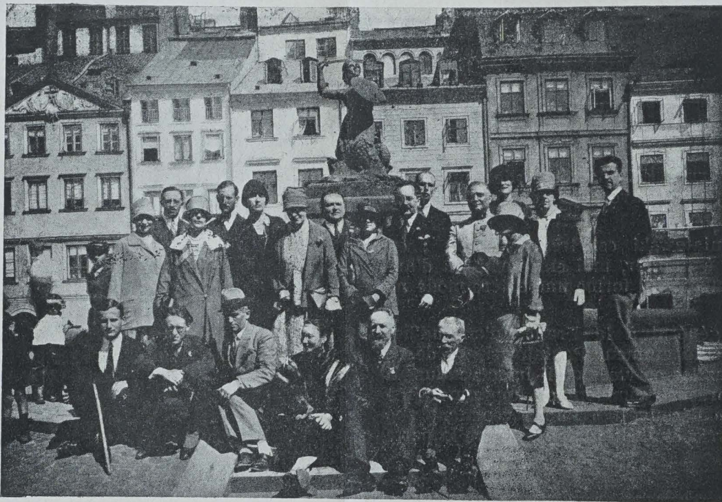
LES A. P. A VARSOVIE EN 1927