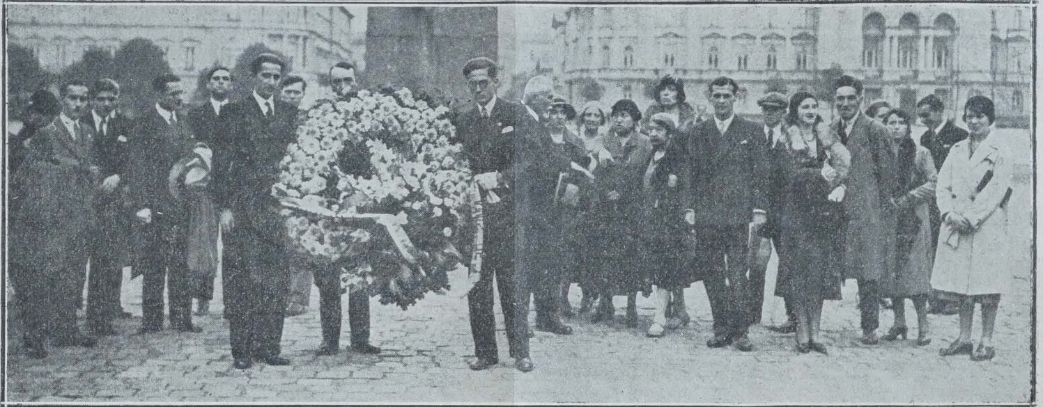
LES ETUDIANTS AMIS DE LA POLOGNE AU TOMBEAU DU SOLDAT INCONNU A VARSOVIE