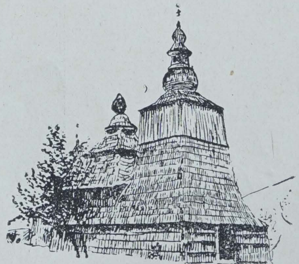
EGLISE EN BOIS