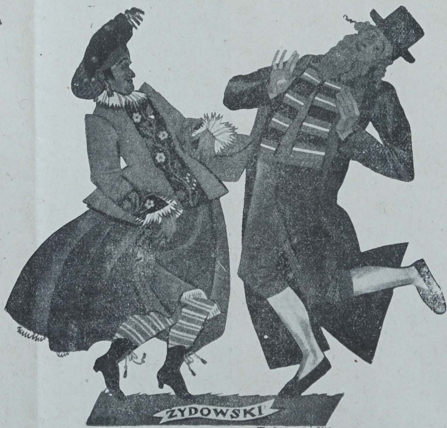
ZYDOWSKI Z STRYIENSKA