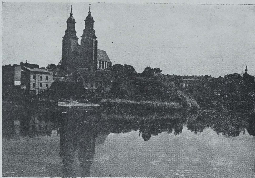
UNE VUE DE GNIEZNO

Il y avait une fois trois frères, Lech, Czech et Rus. C'étaient des princes slaves. Ils voyageaient beaucoup, ils faisaient des lieues et des lieues par jour en cherchant des pays où ils pussent s'établir. Bientôt, ils se séparèrent et chacun d'eux, avec sa suite, continua sa route. Un de ces frères, Lech, arriva en Pologne. Comme il n'y avait pas alors de routes et de chemins commodes comme aujourd'hui, le duc dut traverser de grandes forêts pleines d'animaux sauvages. Un soir, il arriva avec sa suite dans une clairière. Les hommes étaient si las que le chef ordonna d'y faire halte et d'y passer la nuit. On se mit tout de suite à ramasser des branches sèches pour faire du feu. Ceux qui étaient allés chercher du bois trouvèrent un nid d'aigle, ils appelèrent le duc. Quand Lech arriva, il vit en effet un nid d'aigle sur un chêne au milieu de la clairière. Au-dessus de l'arbre volait un superbe aigle blanc. Cet événement fut considéré comme un heureux présage de