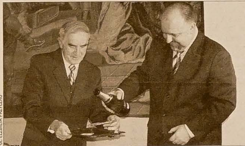
Płyte „Skoro zapomniane - po naszymu” „ochrzczono” w poniedziałek na zamku we Frysztacie.

Teksty przeznaczone do nagra- nia wybrane zostały tak, by repre- zentowały wszystkie gatunki gór- niczych opowieści - życie w koloni- ach, zainteresowania górników, co się gotowało i jadło. Na płycie znalazły się zarówno prawdziwe przygody z życia, jak i wymyślone historie, anegdota i liczne humory- styczne opowieści, które dowodzą mistrzowskiego gawędziarstwa gór- ników i ich poczucia humoru. Opo- wiadane historie odgrywiają się w kopalniach, w koloniach, w których górnicy mieszkali, ale i w gospo- dach. Ciąg dalszy na str. 2