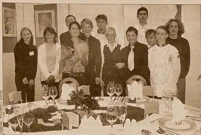
Ekipa z ul. Frydeckiej