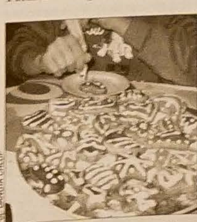
Pierniczki miodowe zdobimy lukrem z białka.

Składniki: 3 jajka, 20 dkg cukru pudru, 17 dkg płynnego miodu, 10 dkg margaryny, 65 dkg mąki, 1 łyżeczka sody oczyszczonej, 1 łyżeczka proszku do pieczenia, 1,5 łyżeczki cynamonu, 1 łyżeczka tłuczonych goździków, 1 jajko na posmarowanie. Wykonanie: Ubijamy do białości jajka, cukier i margarynę, później dodajemy miód i przyprawę. Na koniec dodajemy mąkę z proszkiem do pieczenia i sodą. Rękami wyrabiamy gładkie ciasto. Zapakujemy go do folii mikrotenowej i zostawiamy przez 12-24 godz. w chłodnym miejscu. Rozwałkujemy i wycinamy ciasteczka, które przed wstawieniem do piekarnika smarujemy jajkiem. Po wystygnięciu pierniczki zdobimy lukrem przygotowanym z 1 białka i 15 dkg cukru pudru.