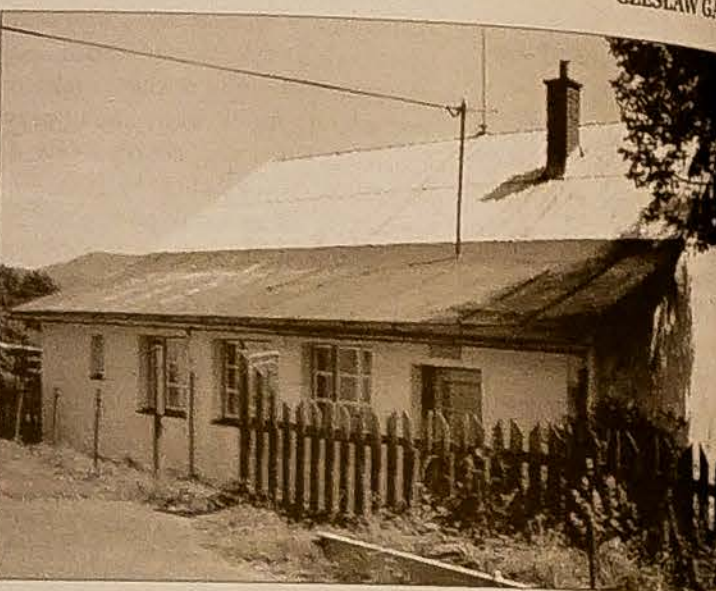
Siedziba PZKO w Koszarzyskach.