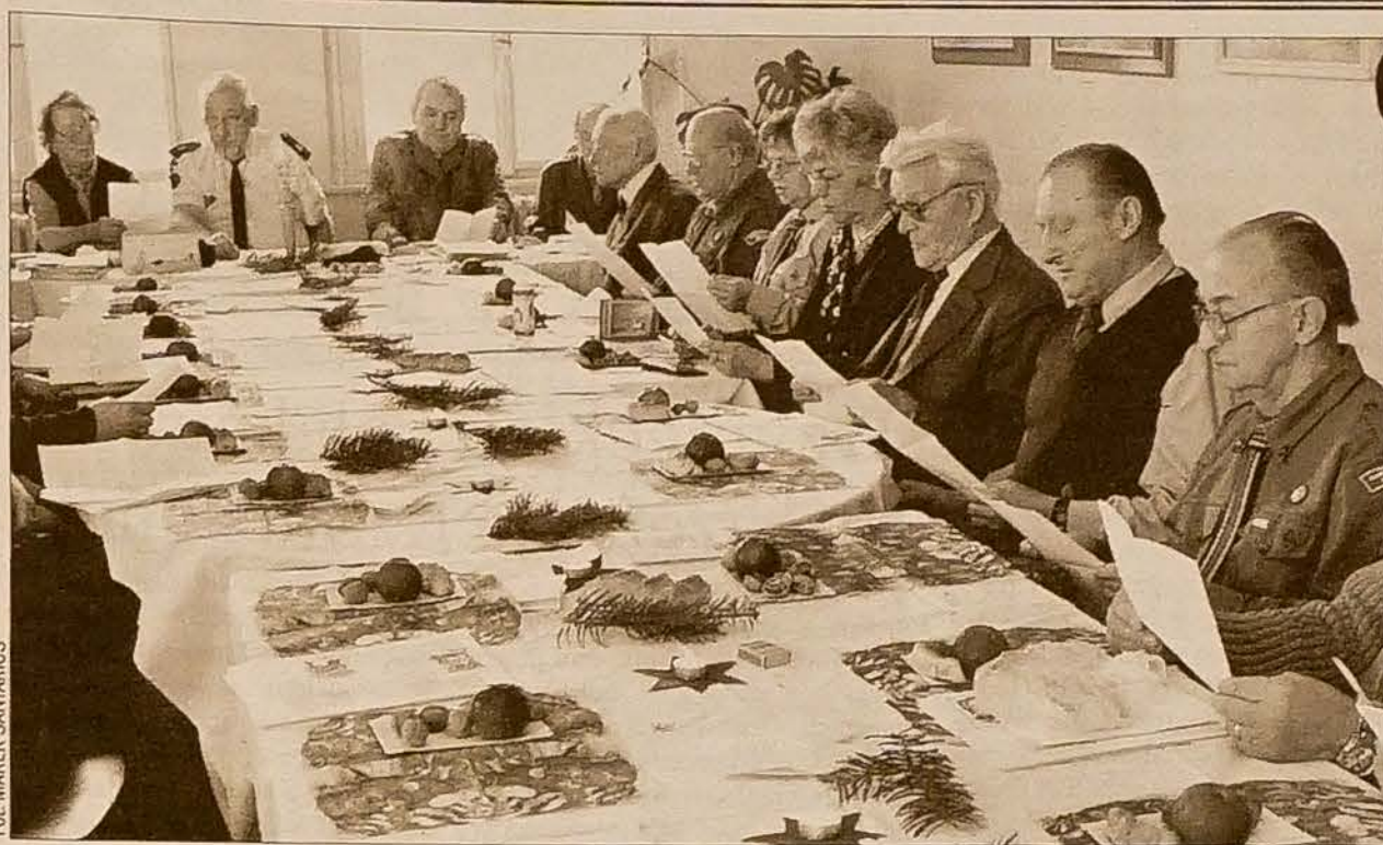
Wczoraj spotkali się w sali konferencyjnej Kongresu Polaków w Cz. Cieszynie na tradycyjnej „Wigilijce” członkowie Harcerskiego Kręgu Seniora „Zaolzie”. Ponad dwadzieścia osób rozpoczęło uroczystą zbiórkę od odśpiewania hymnu harcerskiego, później przyszła kolej na kolędy. Był tradycyjny opłatek wigilijny, jabłka i orzechy. (dc)

dzimy zajęcia terapeutyczne, rehabilitację. W ro- dzinach stwierdzamy, z czym senior sam potrafi się uporać, jakie ma przyzwyczajenia i staramy się mu zapewnić taki program dnia, do jakiego przywykł w domu. Z naszych usług korzystają często rodziny opiekujące się seniorem w czasie wyjazdu na urlop, remontu w mieszkaniu itp. Już teraz mamy zapisanych klientów na lato, których rodziny za- planowały już urlop, a dla seniora zamówiły ter- min pobytu u nas. Opieka jest odpłatna. Klient płaci za zakwa- terowanie i posiłki oraz za pomoc w czynno- ściach, z którymi sam nie potrafi się uporać, wykorzystując do tego celu zasiłek, który z racji niepełnosprawności otrzymuje od państwa.