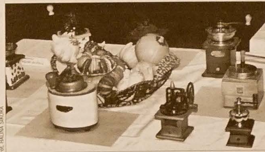
Uwagę zwiedzających wystawę „Kreatywnie, twórczo w każdym wieku, w każdym czasie” przyciągała zwłaszcza kolekcja młynków.

- Postanowiliśmy zmobilizować wszystkich członków, którzy mają jakieś pasje i zainteresowania, aby zaprezentowali je u nas - powiedziała redakcji wiceprezes MK PZKO Re-