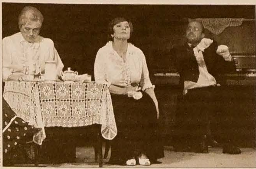
Wędryńscy aktorzy zagrali koncertowo swoją najnowszą premierę „Rybka we czworo”.