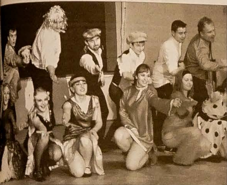
Wśród tancerzy przedstawiło się po kilkoro tancerzy, za każdym razem w innej strojach, co widać w końcowej scenie zbiorowej.

„Spotkanie przy małej czarnej” nie było tylko, jak sugeruje nazwa, wieczorem towarzyskim przy kawie. Impreza miała charakter balu trwającego do wczesnych godzin rannych. Uczestnicy mogli też obejrzeć ciekawą wystawę o historii Koła od jego założenia po współczesność. Zdjęć, dokumentów i kronik całego Koła, jak i poszczególnych chórów i zespołów, było naprawdę dużo. Wszystkie wiele mówiły nie tylko o działalności PZKO, lecz również o okresie, w którym powstały. I tak przypomnieliśmy sobie sprawozdania odsyłane do ZG, na których odnotowywano m.in. udział pezetkaowców w pochodzie pierwszomajowym, czy godziny odpracowane w czynie społecznym w warsztatach kopalni, zaś w numerze noworocznym kwartalnika MK z 1970 r. mogliśmy przeczytać, że kierownictwo Koła na szczęście nie dało posłuchu poglądom szowinistycznym i antyradzieckim i nie uległo prawicy, dzięki czemu działalność Koła mogła ulec szybkiej normalizacji. Przeglądając podobne archiwalia, po raz kolejny uświadomiamy sobie, jak ściśle historia PZKO jest powiązana z historią całego społeczeństwa.