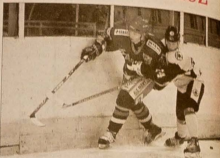
Z meczu Karwina - Uniczow, wygranego przez gospodarzy 4:0.