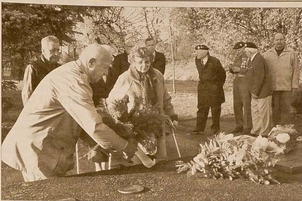
Pod pomnikiem na Konteszyńcu złożył wczoraj kwiaty także przedstawiciele Rodziny Katyńskiej i kombatanci.