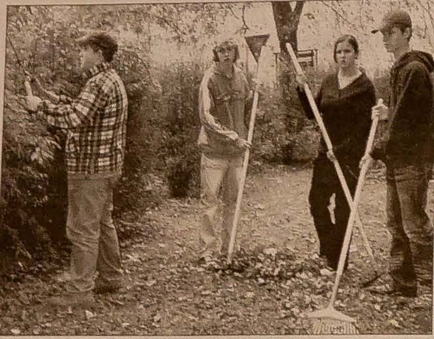
Uczniowie Średniej Szkoły Rolniczej sprzątają park.

Niesygnowane materiały publicystyczne i informacyjne pochodzą z internetowych serwisów informacyjnych.