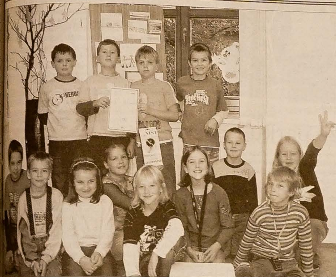
... trzeciej klasy Szkoły Podstawowej z Wędrzyna z przywiezionym z Pragi certyfikatem „eTwinning Quality Label”.

Przed 2000 r., kiedy Ropica była dzielnicą Trzyńca, w budynku oprócz poczty mieścił się sklep spożywczy, restauracja, biblioteka oraz gabinet lekarski.