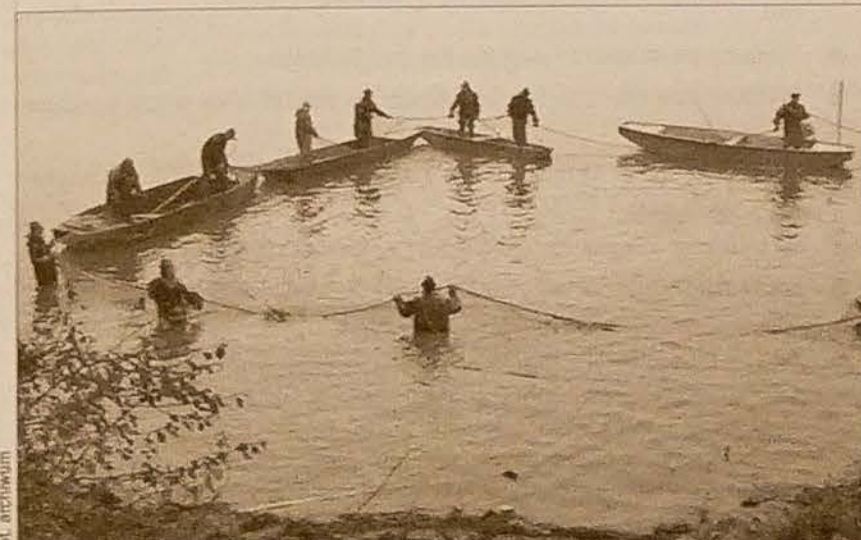
Tak wyglądają rybne żniwa na rychwałdzkich stawach.

Już teraz rybacy twierdzą, że w tym roku nie będzie kłopotów z podażą słodkowodnych ryb przed Wigilią. Wiadomo jednak, że będą one droższe o 6-10 proc. w porównaniu z cenami w ub. roku. Podrażała bowiem pasza, znacznie wzrosły też wydatki związane z produkcją. Przeciętna waga tegorocznego karpia wynosi 2,6 kg, a cena za jeden kilogram ryby kupionej w firmowym punkcie sprzedaży (przy ul. Orłowskiej) waha się w granicach od 75 do 80 kc. W sklepach cena będzie nieco wyższa. Zależać będzie od wysokości marży, jaką nałożą poszczególni handlowcy. Dodajmy, iż za kilogram amura zapłacimy (na miejscu) 80 kc za kg, a szczupaka – 200 kc za kg. (wak)