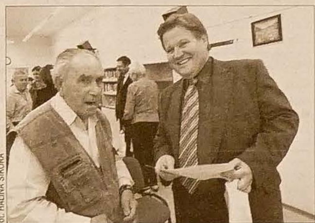
Posel Zdeněk Škromach rozmawia z jednym z mieszkańców trzynieckiego Domu Opieki Społecznej.