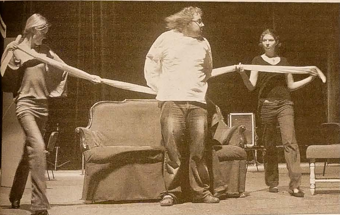
Scena przedstawienia „Mistrz i Małgorzata”.

Wszystko zdążyliśmy się ocknać po wakacjach, a kampania wyborcza w Polsce jest już w pełnym biegu i nadal przyspiesza. Dla zwykłego Polaka oglądanie tego cyklu jest tragicznie komiczna sprawa, natomiast dla politologa to istotna wiadomość. Wiadomo, że w strefie ekonomicznej Polska niemal nie nadążyła za ziemiami czeskiemi. W problematyce marketingu politycznego i kampanii wyborczej jest jednak kilka kawałków przed RC. To książki polskich politologów są obowiązkową na kursach kampanii wyborczych na uczelniach. Nawet dla laika oglądającego wesołe relacje z kampanii partii czeskich i polskich różnica widoczna jest gołym okiem.