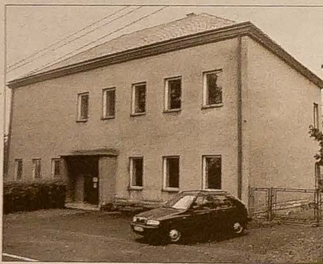
Była polska szkoła w Kocobędzu.

KOCOBĘDZ (gam) – Ciągłe nie wiadomo, jaki będzie dalszy los budynku byłej polskiej szkoły w Kocobędzu. W obiekcie z roku 1898 przy ul. Kocobędzkiej mieści się