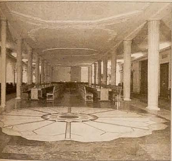
Salon im. Kazimierza Pułaskiego (przewodniczącego podziemnej Rady Jedności Narodowej, 1944-45)

W „Wysokich Obcasach”, dodatku „Gazety Wyborczej”, ukazał się reportaż biograficzny poświęcony wybitnej czeskiej aktorce Władzie Chramostowej. Przynosimy obszernie fragmenty.