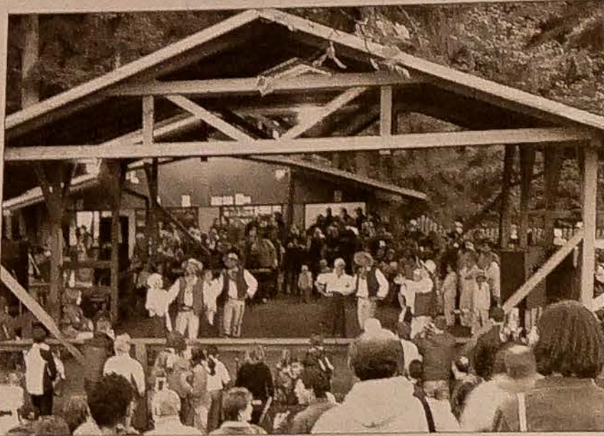
Sporym zainteresowaniem w Koszarzyskach cieszył się zespół „Zaolzi”.

Niesygnowane materiały publicystyczne i informacyjne pochodzą z internetowych serwisów informacyjnych.