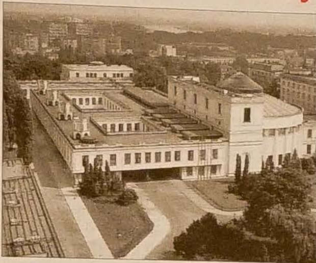
Zespół gmachów sejmowych

Po powstaniu listopadowym władze rosyjskie zlikwidowały Sejm. Miała to być kara za usunięcie Mikołaja I z tronu polskiego przez Sejm powstańczy w 1831 r. W XIX w. pomieszczenia zamkowe zostały całkowicie przebudowane przez zaborcę rosyjskiego. Po odzyskaniu przez Polskę niepodległości w 1918 r. wpłynęło na decyzję o lokalizacji siedziby władzy ustawodawczej. Zdecydowano się na przebudowę, położonego na skarpie wiślanej w Warszawie przy ul. Wiejskiej, kompleksu budynków, w których do 1914 r. mieściła