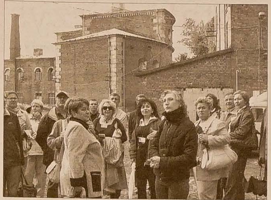
Odwiedziny Twierdzy Modlin wywarły na dziennikarzach niezapomniane wrażenia.