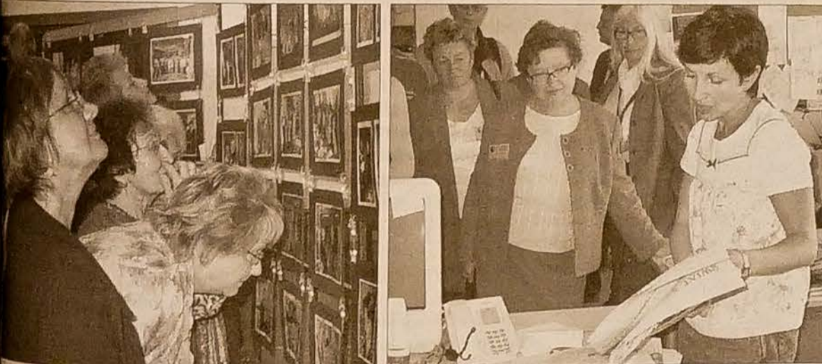
Dziennikarze z zainteresowaniem obejrzeni wystawę zdjęć prezentującą piętnastoletnią historię Forum. W programie Forum były też całonocne warsztaty medialne w redakcjach TV Polonia, Polskim Radiu i „Dzienniku Polska Europa Świat”.