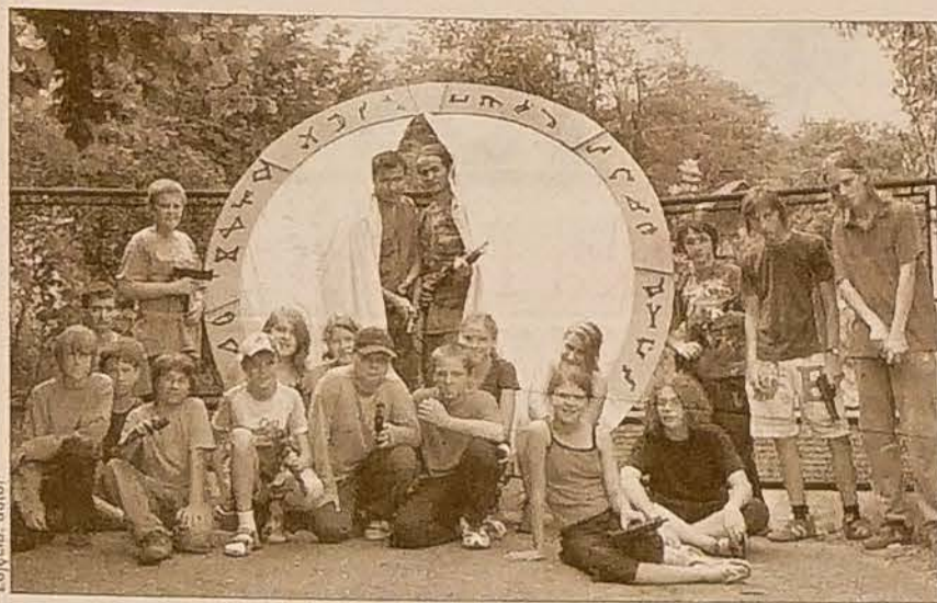
Harcerze przed „Gwiazdnymi Wrotami”.

Kolejny obóz trwa w dniach 27. 7. – 4. 8. w Rzece, a mianowicie drużyna SODH Pusteki, czyli Stonawsko-Olbrachcicka Drużyna Harcerska wraz z Gromadami Zuchowymi – Mądre Sówki z Olbrachcic, Słoneczne Promyki ze Stonawy oraz