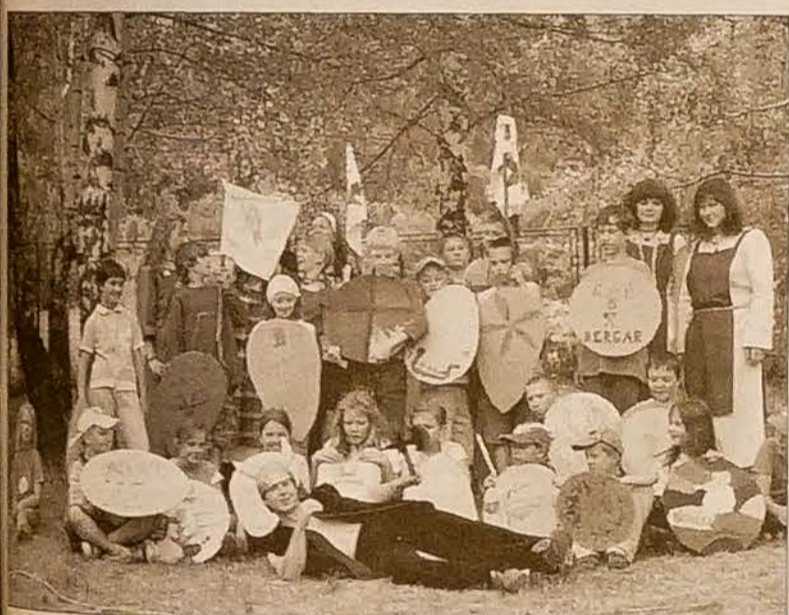
„Wikingowie” w Gutach.