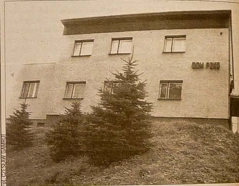
Dom PZKO w Bukowcu.