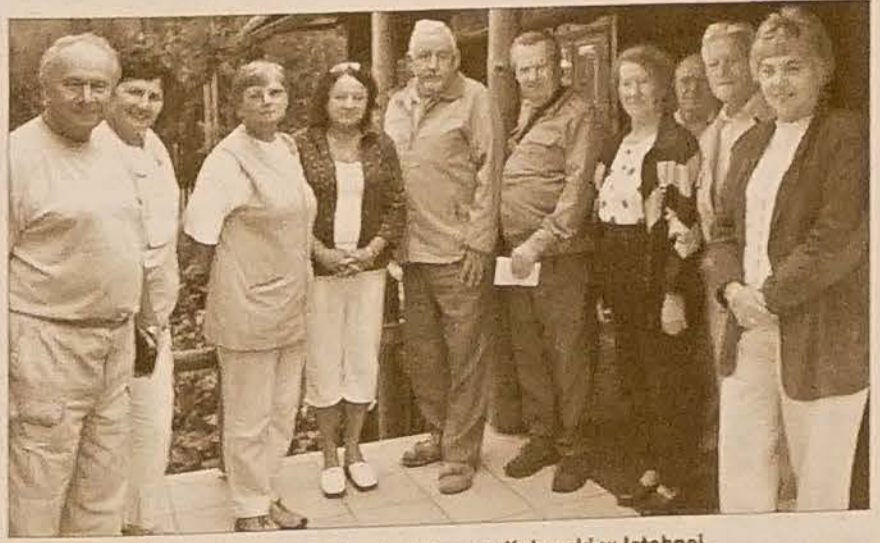
Uczestnicy wycieczki przed Izbą Pamięci Jerzego Kukuczki w Istebnej.