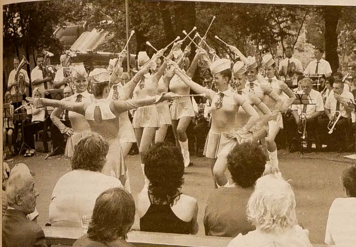
Na stonawskim odpuście wystąpiły m.in. mistrzyni Europy mażoretki „Dixl” oraz orkiestra górnicza Kopalni „Darków”.

WTOREK 24 LIPCA 2007 NR 84 ROCZNIK LXII CENA 6 Kč tel.: 558 731 766 faks: 558 740 044 info@glosludu.cz