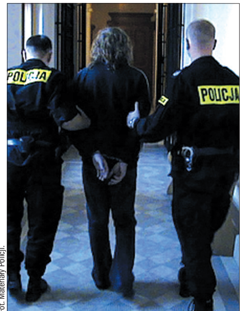
Morderca zgłosił się na policję po sześciu latach milczenia.

Jak dowiedzieliśmy się, obaj mężczyźni staną przed sądem najwcześniej za pół roku. Do tego czasu przejdą m.in. badania psychia-