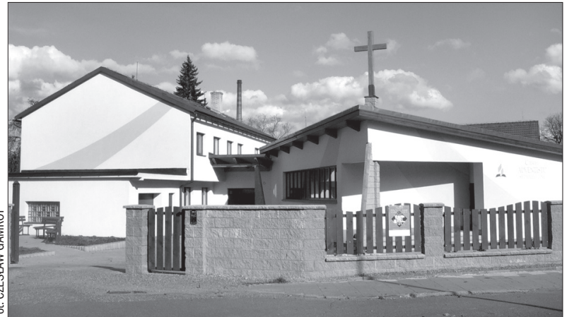
Dom Modlitwy Kościoła Adwentystów Dnia Siódmego w Cz. Cieszynie. Czeskoskocieszyński zbor tego wyznania obchodził w tym roku stulecie swojego istnienia.

dryni (Czytelnia) na tradycyjne zakończenie sezonu turystycznego. Inf.: 732 175 618, 596 311 685.