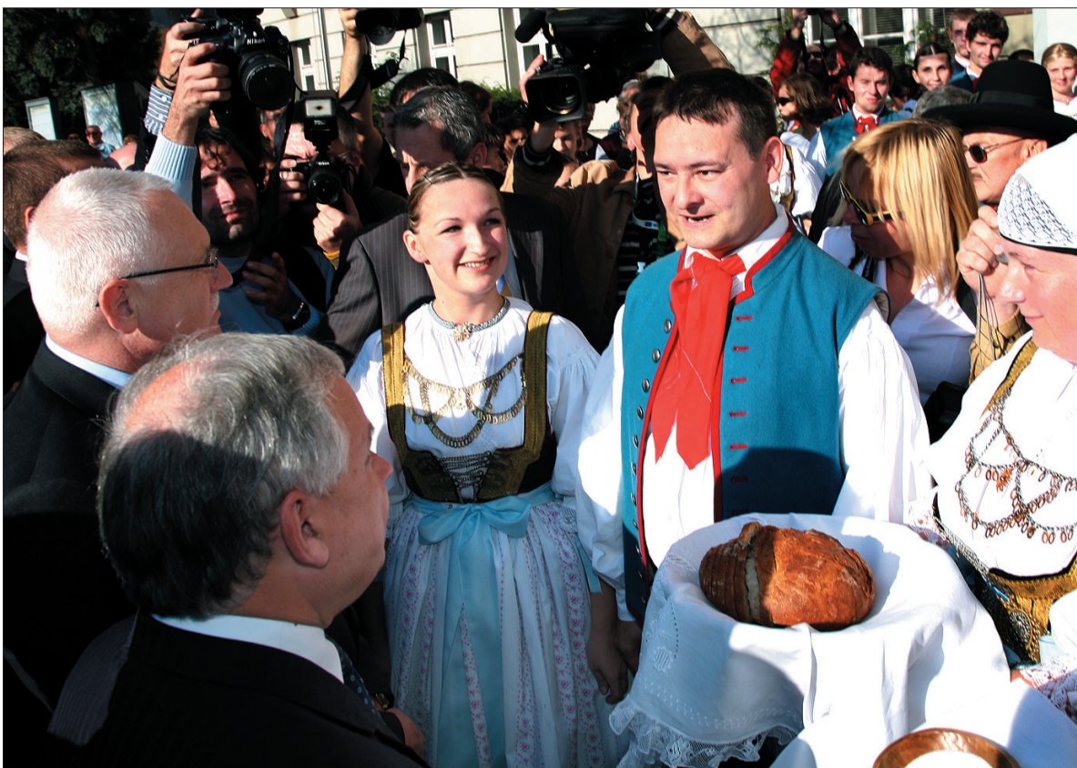
Przed czeskokieszyńskim ratuszem prezydentów witali chlebem i solą członkowie zespołu „Slezan”.

Z mostu obaj prezydenci udali się na pierwsze spotkanie z mieszkańcami miasta do Domu Narodowego i na Rynek w Cieszynie. Przed godz. 15.00 goście z Warszawy i Pragi przekroczyli granicę. Najpierw