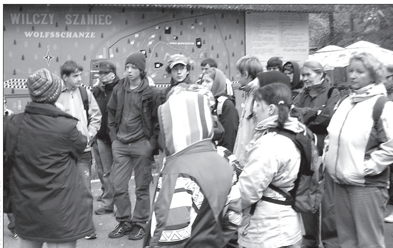
Uczniowie i nauczyciele gnojnickiej PSP rozpoczynają wycieczkę w „Wilczym Szańcu”.