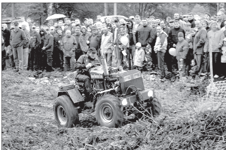
Ponad 400 osób śledziło w niedzielę zmagania wspaniałych mężczyzn na ich „pekających” maszynach.

– Publiczności nie zraziła nawet niesprzyjająca pogoda. Uważamy