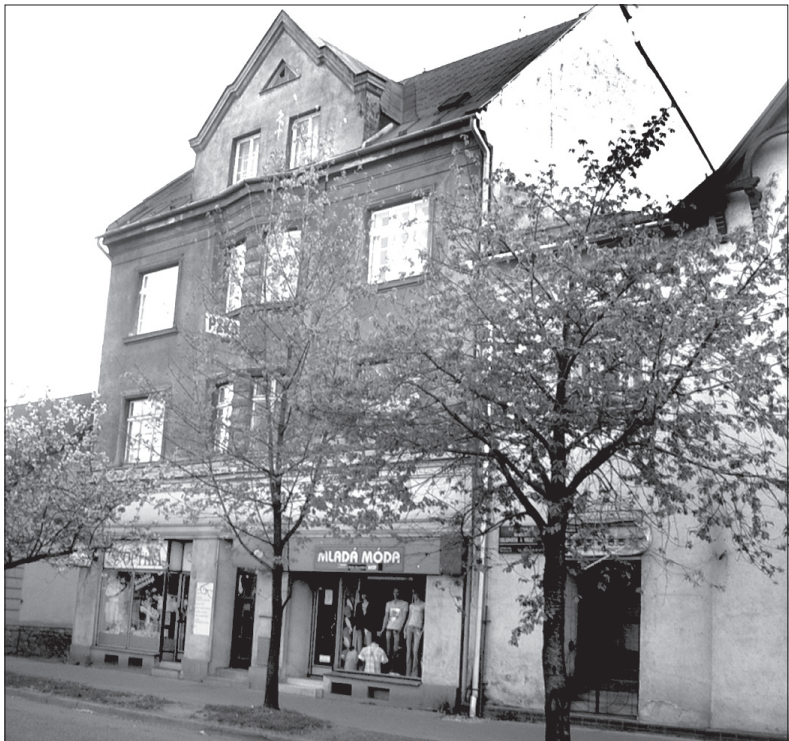
Siedziba MK PZKO w Trzynciu Starym Mieście.