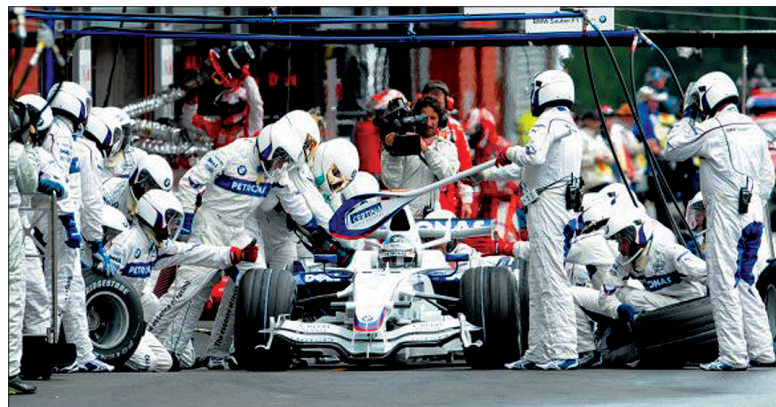
Krzątania w teamie BMW Sauber.

• KUBICA PRZED GRAND PRIX SINGAPURU. Robert Kubica i jego zespół BMW Sauber przygotowują się do pierwszego w historii Formuły 1 nocnego wyścigu, który w najbliższą niedzielę odbędzie się na ulicznym torze w Singapurze. Pełne ręce roboty mają inżynierowie, którzy muszą wybrać optymalne ustawienia, aby bolid spisywał się jak najlepiej. Tor składa z 23 zakrętów. Kubica często będzie używał 1. i 2. biegu, a więc silnik musi mieć dużą moc przy dużych obrotach. Średnia prędkość na torze w Singapurze ma wynosić zaledwie 175 km/h. W klasyfikacji generalnej Grand Prix prowadzi Brytyjczyk Lewis Hamilton przed Brazylijczykiem Felipe Massą. Kubica plasuje się na trzeciej pozycji. • LIGA ŚWIATOWA: RYWAŁAMI BRAZYLIA, FINLANDIA I WENEZUELA. W siedzibie FIVB w Lozannie odbyło się losowanie grup przyszłorocznych rozgrywek Ligi Światowej w siatkówce mężczyzn. Polska zagra w grupie A z Brazylią, Finlandią i Wenezuelą. Rozgrywki grupowe potrwają od 12 czerwca do 19 lipca, zaś finał zostanie rozegrany w dniach 22-29 lipca 2009 r. Organizator turnieju finałowego będzie znany w połowie października. (jb, PAP)