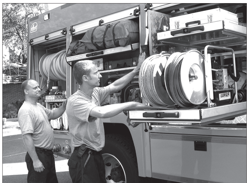
Czeskokoczyńscy strażacy przy nowym samochodzie gaśniczym.