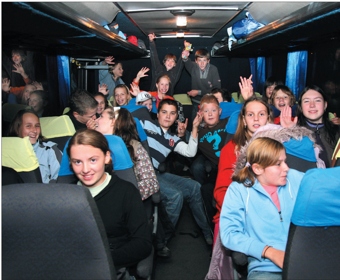
Na twarzach wyjeżdżających na zieloną szkołę siódmaków gości radość – właśnie rozpoczynają dwutygodniową przygodę nad polskim morzem.

Nieprzyjemne chwile nastąpiły jednak przed samym wyjazdem, jeszcze w Cieszynie, kiedy okazało się, że autokary nie przyjechały na miejsce odjazdu na czas. W dodatku, kiedy rodzice zobaczyli, że zamiast zapowiadanych autokarów o solidnym standardzie, dwa z nich to zwykłe Karosy, choć z klimatyzacją, to niektórych ogarnęła panika. Na nic się nie zdały tłumaczenia organizatorów, że to nie oni, ale przewoźnik zawinił... Faktem jednak pozostaje, że odjazd opóźnił się o prawie 2,5 godziny. Rodzice żądali sprawdzenia atestów technicznych autokarów i próby trzeźwości kierowców. Sprowadzona na miejsce policja stwierdziła jednak, że żaden z kierowców nie spożył alkoholu, a wszystkie autobusy posiadają ważne atesty. Krytykowane Karosy mia-