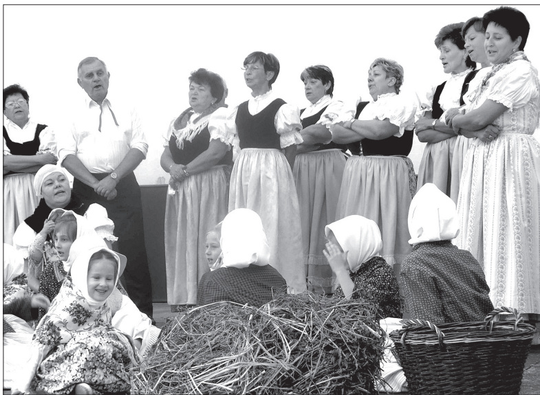
Pokazem tradycyjnych „Wykopiek” zespół „Skotniczka” wraz z chórem „Zaolzie” otworzył Festiwal Kultur Narodowych.