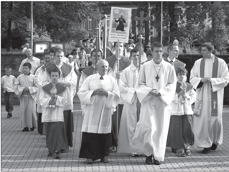
Barwna procesja z relikwiami św. Melchiora Grodzieckiego przybyła w tym roku z Mostu Przyjaźni do czeskokieszyńskiego kościoła pw. Najświętszego Serca Pana Jezusa.