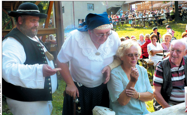
„Kupcie losy, możecie wygrać wino albo czekoladę” – zachęcała para dorodnych „goroli” z Koszarzysk. Redaktorka „Głosu” dopiero przy bliższych oglądziach odkryła, że wysoka, postawna „baba” to w rzeczywistości... „chłop”!

– Udział bierzemy we wszystkich Babskich Festynach i spotkaniach Klubów Kobiet; i to liczną grupą. Dzisiaj jest nas tu mało, aż wstyd... – powiedziały „Głosowi” członkinie