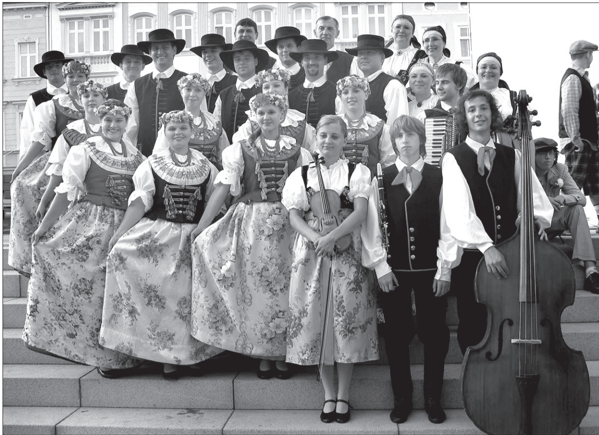
„Suszanie” na Rynku Głównym w Rzeszowie w strojach rozbarskich.

Nawiązując do rzeszowskiego festiwalu, w którym w br. udział brały dwa zespoły zaolziańskie – „Olza” i „Suszanie”, B. Mračna wspomina najważniejsze dla „Suszan” momenty. Gorąco został przyjęty przez rzeszowską publiczność 20-minutowy występ, na który składały się tańce rozbarskie, „klobukowy”, „cepowy” i wiązanka cieszyńska. Dużo wra-