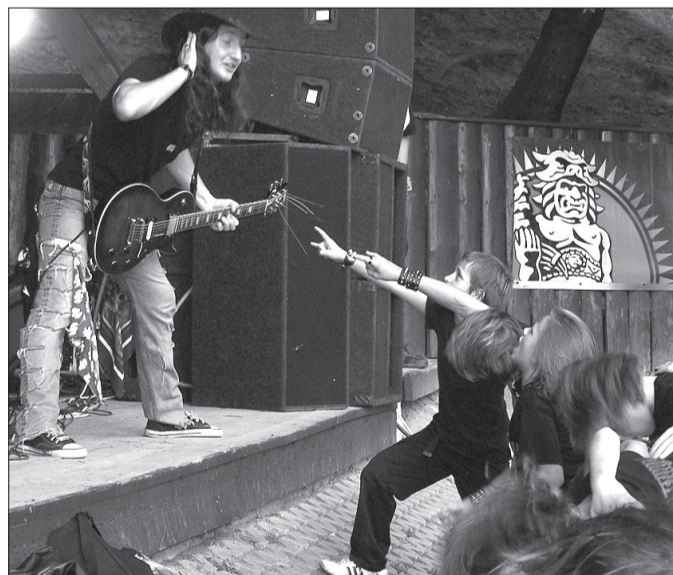
Na „Gorolskim Dymie” w Jabłonkowie młodzież bawiła się doskonale m.in. podczas występu miejscowej kapeli „Witch Hammer”.

Oprócz wspomnianych już gwiazd w Lasku Miejskim zagrały w piątek także formacje: „Po prostu”, „Pier”, „Witch Hammer”, „Skandal”, „Codex” oraz „Odnaha”.