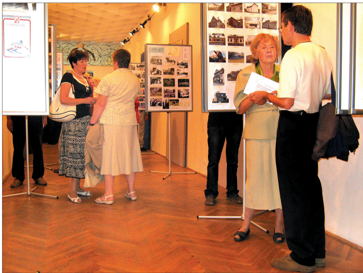
Wystawę o 60-leciu PZKO można zwiedzać w Muzeum Archidiecezjalnym w Katowicach do 5 października. Później przeniesiona zostanie do Biblioteki Śląskiej.

Chociaż wystawę zainstalowano w jednym z dwóch pomieszczeń przeznaczonych na wystawy czasowe, samo otwarcie odbyło się w sali ze stałą ekspozycją (zabytki