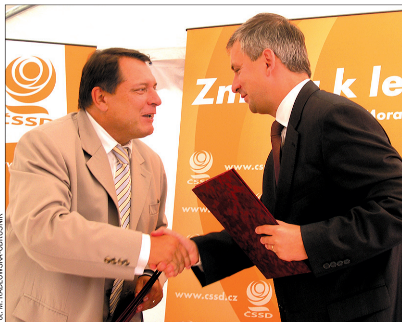
Jiří Paroubek (ČSSD) i Grzegorz Napieralski (SLD) po podpisaniu memorandum o współpracy i wspólnego stanowiska w sprawie instalacji w RP i RC elementów amerykańskiej tarczy antyrakietowej uściskali sobie ręce.

Na oczach dziennikarzy podpisano też wspólne oświadczenie odrzucające dwustronne umowy rządów Czech i Polski z rządem USA, wciągające te kraje bez konsultacji z obywatelami do amerykańskiego systemu obrony przeciwrakietowej. W oświadczeniu wskazuje się m.in. na to, że posunięcia te nakreślają nowy wyścig zbrojeń.