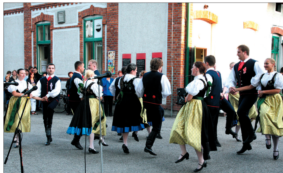
„Suszenie” tańczą w parku olbrachcickiego Domu Robotniczego. W 116 szczyt domu-jubilata.

ściciela. Zainwestował w nowo nabyty obiekt niemałe środki, by mógł on spełniać nowoczesne kryteria jakości i – jako drugi po Domu PZKO – dobrze służyć ludziom nie tylko jako lokal gastronomiczny, ale także jako ośrodek życia towarzyskiego i kulturalnego w Olbrachcicach.