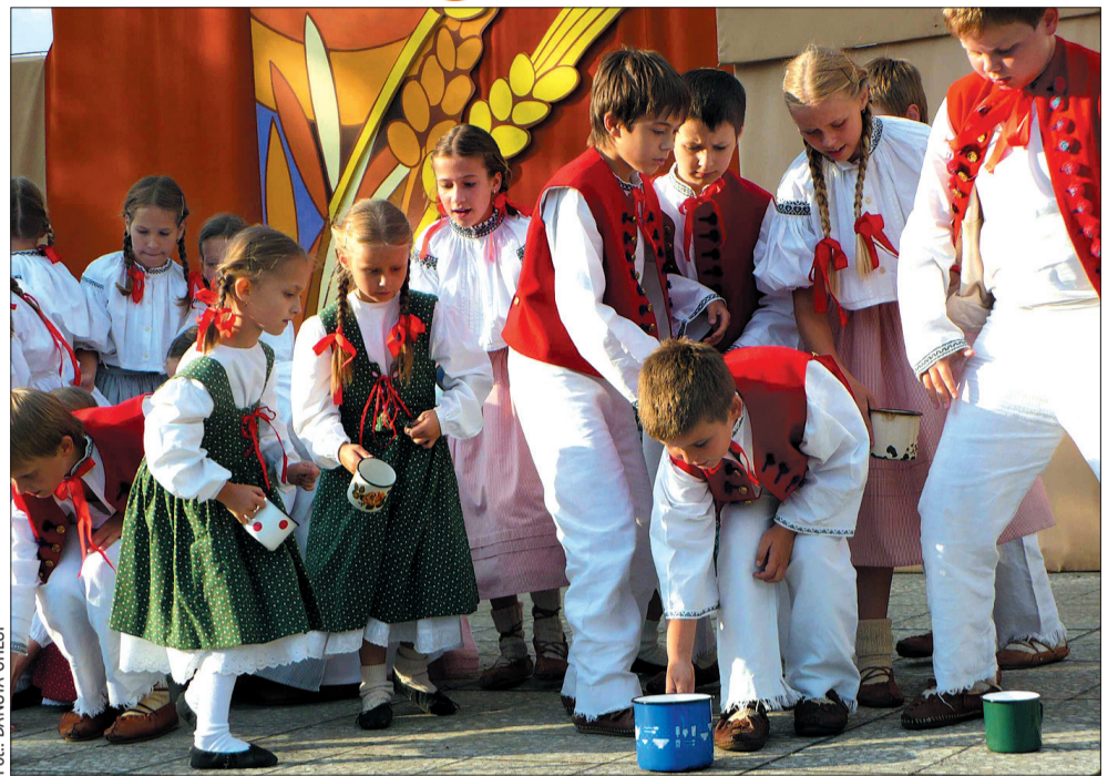
Najmłodszy tancerze zespołu „Vonička” przedstawili formę zabawy m.in. zbieranie jagód.