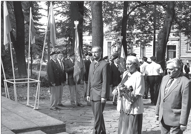
Przedstawiciele Kongresu Polaków w RC oraz PZKO składają kwiaty pod pomnikiem poległych w walce z hitlerizmem w latach 1939-1945.

odbyło się spotkanie weteranów II wojny światowej z władzami miasta i powiatu.