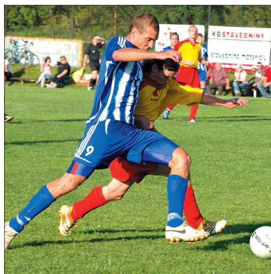
Z meczu Gródek – Oldrzychowice.