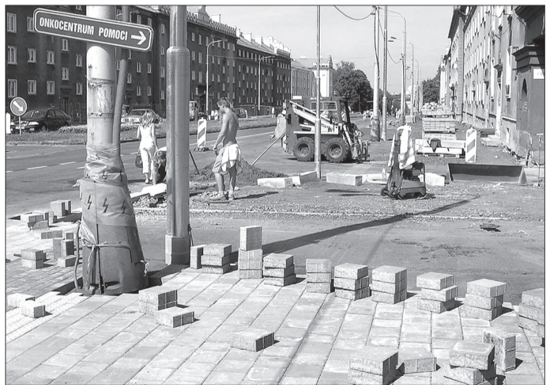
Chodniki wzdłuż ul. Głównej w Hawierzowie to jeden wielki plac budowy.

W ramach przebudowy chodników zostaną posadzone nowe drzewa – graby piramidalne. Gatunek ten został wybrany ze względu na zwarty kształt korony, nieprzeszkadzający w ruchu i ułatwiający utrzymanie chodników, a także z powodu odporności grabów na zanieczyszczenie środowiska. Jeszcze w tym roku posadzonych będzie 52 drzewek. Dla każdego z nich będzie zainstalowany system nawadniający. Drzewka będą chronione specjalną kratą żeliwną opatrzoną godłem miasta.