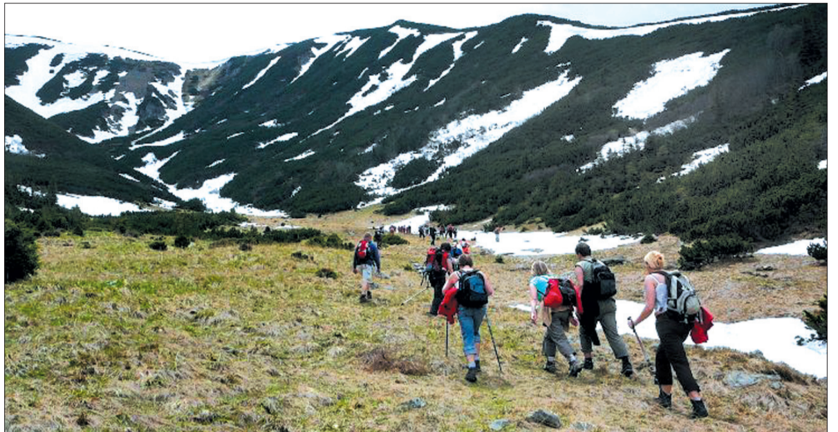
W drodze na pietrosul

Po zwiedzeniu unikatowego cmentarza kontynuowaliśmy naszą podróż na wschód, zahaczając o urokliwe miasto Sighetu Marmatiei. Znajduje się w nim wiele interesujących budowli i obiektów. Jednym z nich jest muzeum ofiar komunizmu założone w 1992 roku na terenie byłego więzienia dla przeciwników politycznych. Miejsce pamięci