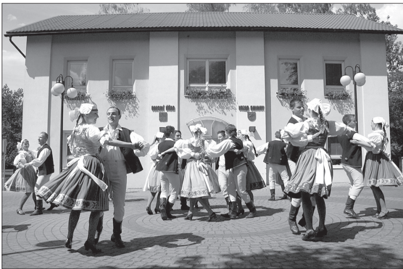
Na festiwalu w Rzeszowie „Suszanie” przedstawią m. in. tańce z Zachodnich Czech – na zdjęciu przed Urzędem Gminy w Suchej Górzej.

Zespół zaprezentuje w Rzeszowie przede wszystkim tańce cieszyńskie (głównie na koncercie galowym) oraz tańce z Zachodnich Czech. – Te przygotowaliśmy na koncert, na którym każdy z zespołów przedstawia kulturę kraju,