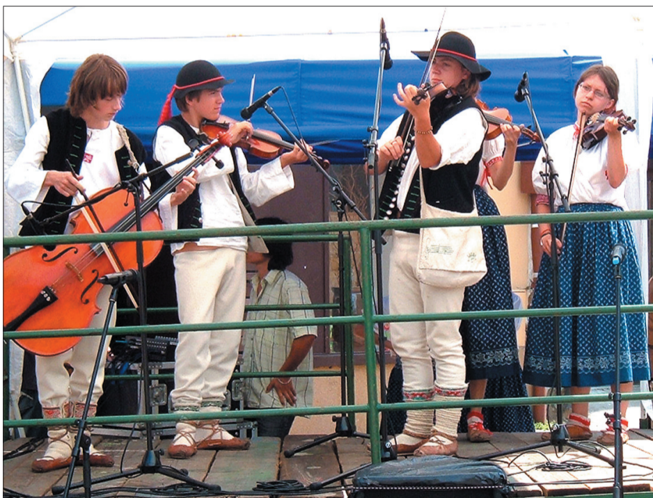
Dla „Lipki” występ na jarmarku był ostatnim przed wyjazdem na festiwal w Rzeszowie.