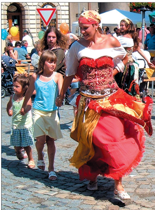
Członkowie bractwa „Rytíři sv. Grálu” zaprosili do zabawy także dzieci.