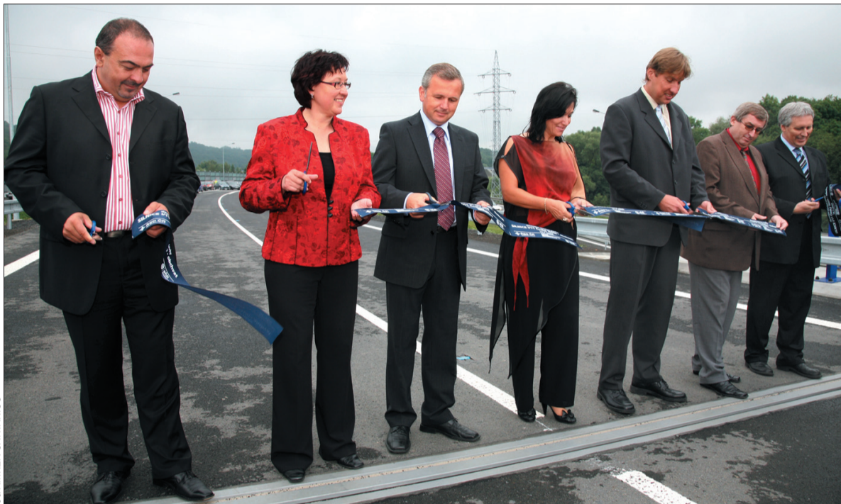
Nożyce poszły w ruch. Mieszkańcy Cz. Cieszyna odetchnęli z ulgą...