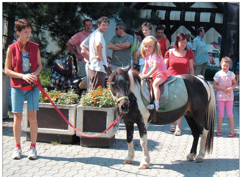
Przed niedzielnym obiadem dobrze jest pojeździć na kucyku.