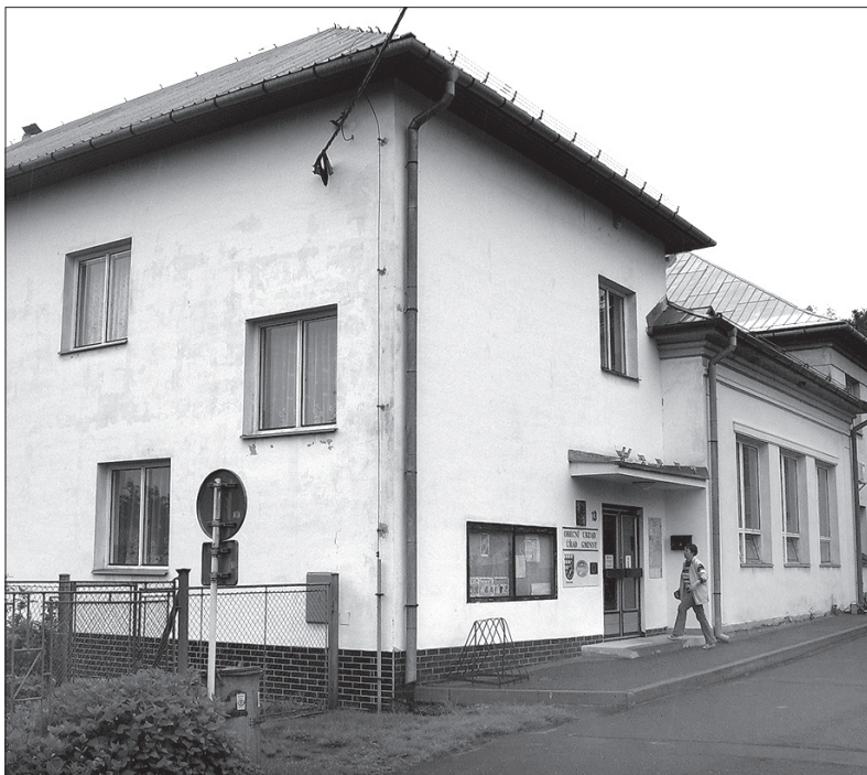
Pezetkaowcy spotykają się w budynku Urzędu Gminnego w Śmiłowicach.