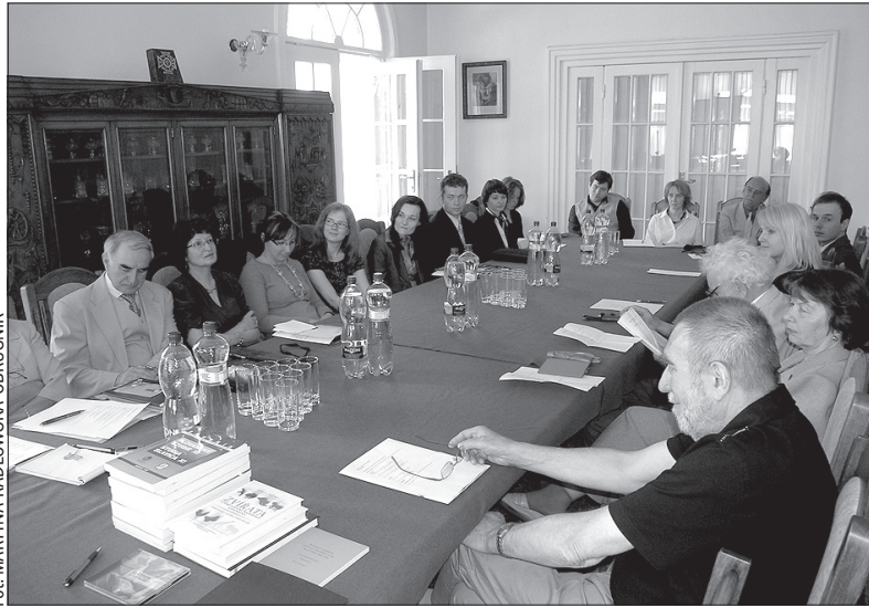
Za stołem obrad pierwszej po blisko dwudziestu latach Konferencji Polonistów RC i RS zasiadło 20 naukowców z Pragi, Brna, Ostrawy, Ołomuńca i Bratysławy.

władze uniwersyteckie winny sobie uświadomić, że kierunek studiów o takiej dynamice winien uzyskać podmiotowość samodzielnej katedry. Do tej pory polonistyki nie zajęły takiego miejsca na czeskich uniwersytetach, jakie w Polsce zajmuje bohemistyka. Ten boom to widomy sygnał dany przez społeczeństwo, że stosunki polsko-czeskie także w dziedzinie nauczania zyskują nową jakość – podsumował obrady J. Kronhold.