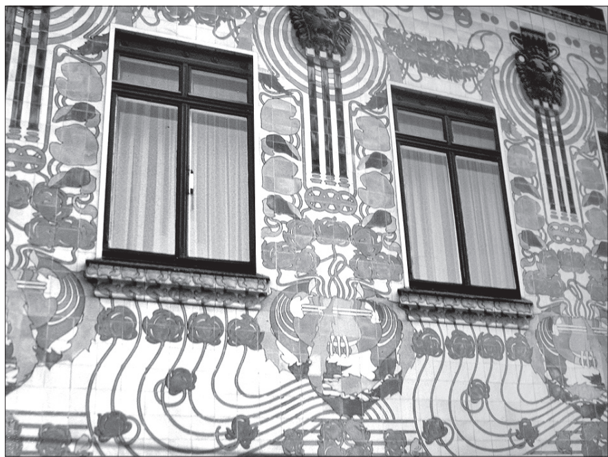
Dom majolikowy zrealizowany przez Otto Wagnera na alei Linke Wienzeile nr 38 i 40 w Wiedniu.

Trzecia wystawa dotyczy prac uczniów Otto Wagnera w Ostrawie. Oprócz wspomnianego już Wunibalda Deiningera chodzi też o Otokara Béma (projekt klasztoru Sióstr Miłosierdzia św. Krzyża – obecnie rektorat UO, tzw. Czernona Szkoła na ulicy 30. Dubna) i Františka Fialę (budynek wodociągów miejskich w Nowej Wsi, budynek administracji kopalni Michał). Ta wystawa została przygotowana ze zbiorów fotograficznych i dokumentalnych muzeum ostrawskiego.