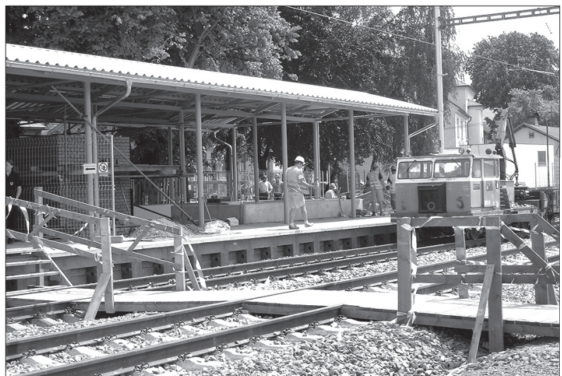
Na dworcu kolejowym w Bystrzycy rozpoczęto już budowę przejścia podziemnego.

DDM zorganizuje jeszcze imprezę dla maluchów z przedszkoli, na którą tradycyjnie przyjeżdżają także przedszkolaki z okolicznych gmin.