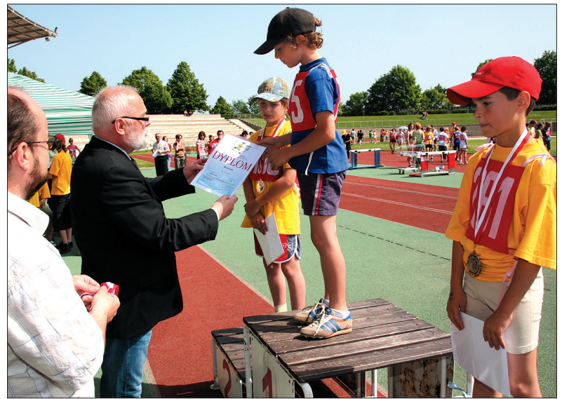
Dyplomy najlepszym wręcza konsul generalny Jerzy Kronhold.