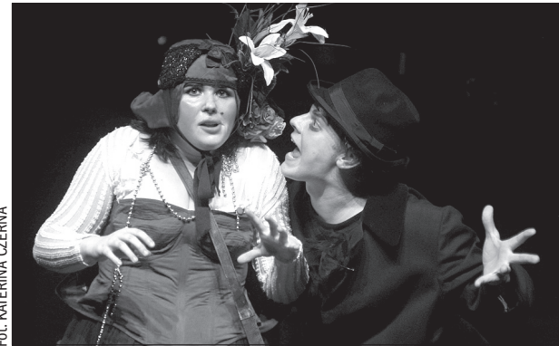
W ramach festiwalu wystąpił m.in. teatr Divadlo Husa na Provnázku z przedstawieniem „O Krásné Dišperandě a ctovstné Julii”

Dziś jeszcze zobaczyć można m.in. przedstawienia „Prečo nie som anjel” teatru Divadlo na Rázcestí z Bańskiej Bystrzycy oraz „Lásky jedné plavovlásky”, które pokaże Divadlo Husa na Provázku z Brna. Natomiast wieczorem w namiocie teatralnym przy Ośrodku Kultury „Strzelnica” wystąpi grupa „Świetliki”. Tam odbędzie się również ceremonia wręczenia nagrody głównej festiwalu – „Złamanego Szlabanu”. W części konkursowej wystąpiły zespoły renomowane, a w części nazwanej OFF Festiwal zobaczyć można było przedstawienia teatrów niezależnych, alternatywnych, które przedstawiają młodą i kontrowersyjną twarz nowoczesnego teatru.