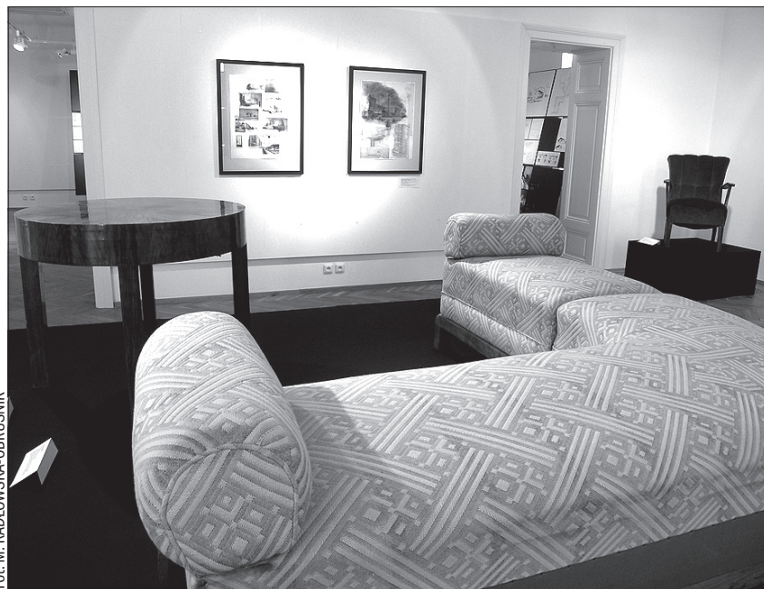
Oryginalne meble z lat 30. ub. wieku zaprojektowane i wykonane pod nadzorem Wunibalda Deiningera dla Ilse Spängler. Własność Muzeum w Salzburgu.

Wystawa „Wunibald Deininger, architekt i designer” przedstawia imponujące budowle modernistyczne zarówno w planach, jak i na pokazywanym na ekspozycji filmie dokumentalnym (wydawnictwo „Kiesel”, koszary policji na Rudolfsplatz czy de facto pierwszy komunalny kompleks „Hirschenwirtsweie” w Austrii). Wiele z przedstawianych budynków przypomina te ostrawskie, albowiem Wunibald Deininger działał również w mieście nad Ostrawicą (zaprojektował m.in. hotel „Nacional”, Bank Handlowo-Rzemieślniczy oraz wiele domów prywatnych). Jego budynki są oryginalne, przestrzenne, a co charakterystyczne – architekt opracowywał je nawet w najmniejszych detalach, takich jak: lampy, stropy, framugi, drzwi, szafy, co widać