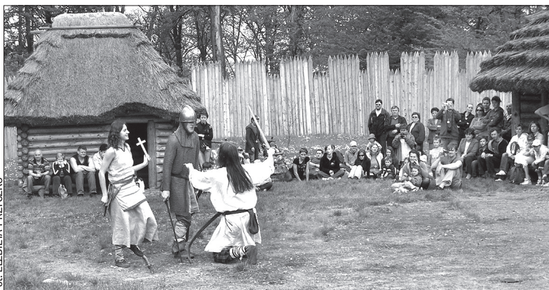
Częścią programu przygotowanego dla zwiedzających było przedstawienie o życiu św. Wacława, wykonane przez grupę „Tizon”.

1 maja, w dzień otwarcia sezonu w Archeoparku, zainteresowanych zwiedzeniem grodziska nie brakowało. Dorośli, dzieci i młodzież licznie przybyli do Kocobędza, by zobaczyć, jak wyglądało życie dawnych Słowian. Archeopark otwarty będzie do października. W planach jest budowa dalszych elementów grodziska oraz postawienie centrum edukacyjnego. Cały projekt ma zostać zrealizowany do 2012 r.