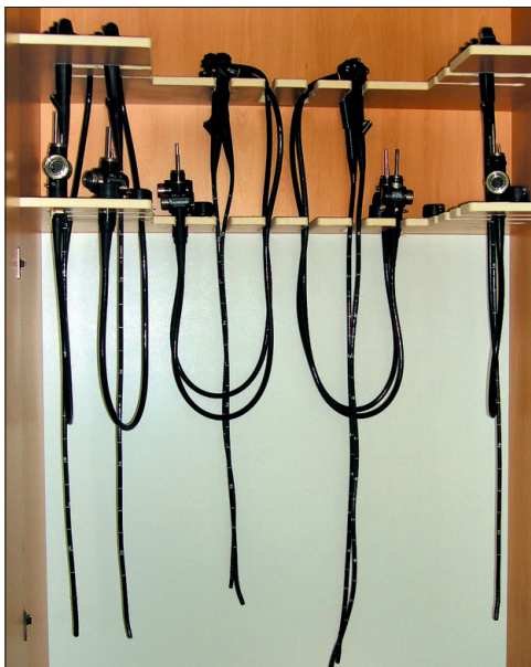
Zestaw endoskopów – instrumentarium gastroenterologa.

Co ich sprowadza do doktora? Pytanie to tylko z pozoru jest pozbawione sensu. Bo kto – szczególnie dziś, kiedy taka wizyta jest równoznaczna z odmówieniem sobie na przykład przyjemności wypicia dwóch kufli piwa – przychodzi do lekarza bez powodu? – Niestety, większość stanowią pacjenci, u których wystąpiły wyraźne objawy chorobowe, jak krew w stolcu, wzdęcia, bóle brzucha, spadek wagi ciała, częste rozwolnienia... Powiedziałem „niestety”, bo wolimy przyjmować osoby, które nie mają żadnych problemów zdrowotnych ani wymienionych objawów. Jaki to ma sens? Ano taki, że skierowanie do nas dostały na podstawie tak zwanego testu bezobjawowego, którego celem jest wyszukiwanie ludzi mogących zachorować na nowotwór jelita grubego.