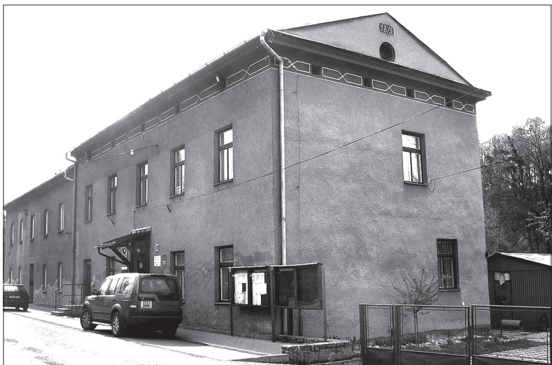
W budynku byłej szkoły w centrum Ropicy znalazła też lokum świetlica PZKO.

ców znajduje się w budynku byłej polskiej szkoły, gdzie mieści się też Urząd Gminy, poczta, biuro Czeskiego Telecomu oraz biblioteka. Do dyspozycji mają salkę z kącikiem kuchennym. Obiekt liczy już blisko dwieście lat. Wybudowała go w 1810 r. własnym sumptem właścicielka tutejszych dóbr hrabina Gabriela Cselesta ze Skrbeńskich. W 1870 r. z powodu wzrastającej liczby uczniów dobudowano do niego jedno piętro. CZESŁAW GAMROT