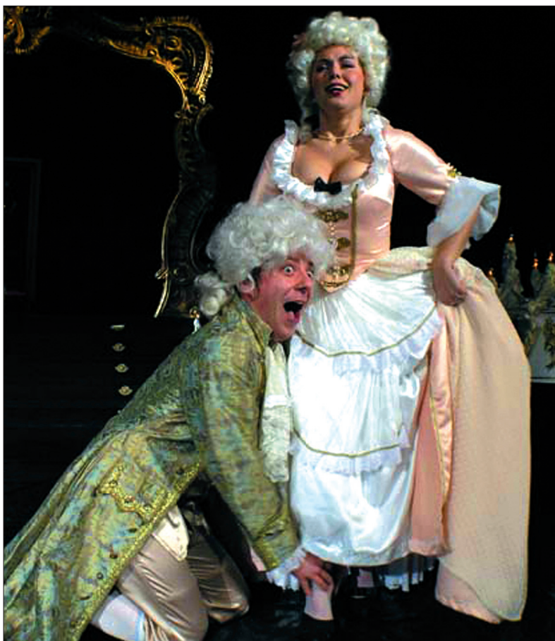
W roli Konstancji, żony Mozarta.