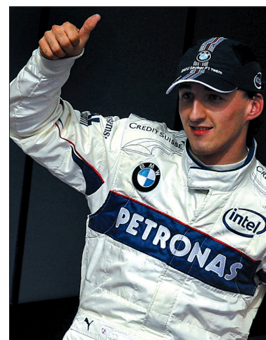
Robert Kubica - 3. kierowca GP F1.

Już po raz trzeci spotkają się w Domu Kultury „Strzelnica” szachiści z obu stron Olzy, by walczyć o puchar burmistrza Czeskiego Cieszyna. 1 maja przy królewskiej grze oprócz uczestników spotkają się także burmistrzowie Cieszyna i Czeskiego Cieszyna. Turniej rozpocznie się o godz. 9.00 rejestracją i programem artystycznym. Uroczystego otwarcia dokona Burmistrz Czeskiego Cieszyna, Vít Slováček. Od godz. 10.00 do 15.00 będzie czas na grę. (ep)