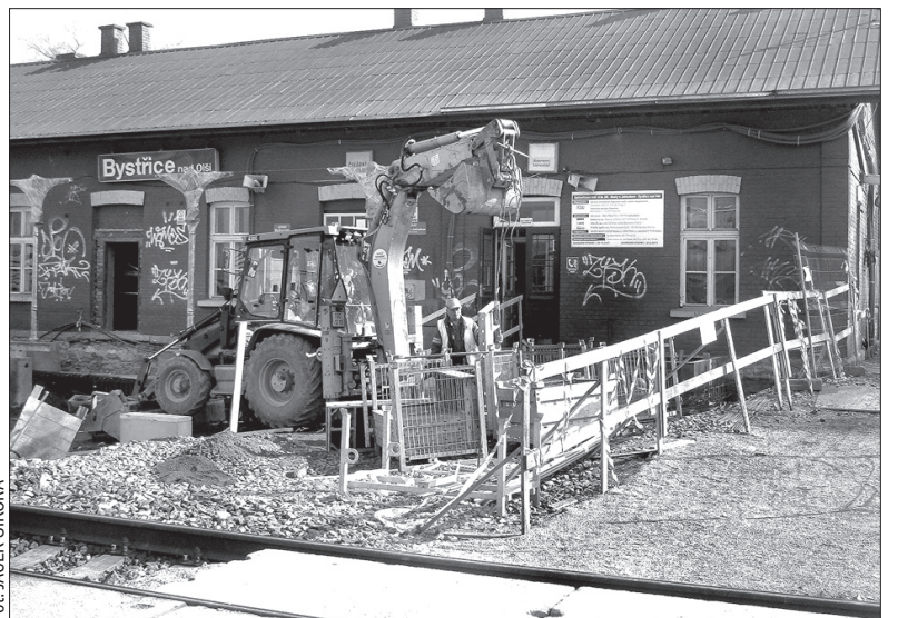
Bystrzycki dworzec kolejowy przemienił się w plac budowy, co poniekąd komplikuje życie podróżnym.

Ciekawa droga, trzeba przyznać. Dzieciństwo Zamenhafa upłynęło w środowisku wielonarodowościowej społeczności złożonej głównie z Żydów, Polaków, Rosjan i Niemców. Mając 10 lat, napisał dramat Wieża Babel, czyli tragedia białostocka w pięciu aktach , uważał bowiem, że główną przyczyną nieporozumień i sporów między ludźmi jest bariera językowa. Jeden, wspólny język miał być jej rozwiązaniem. Nie przypominam sobie, żeby język esperanto rozwiązał problemy narodowościowe akurat w Białymstoku. Pomógł raczej tym na wyższych szczeblach. A ja sobie tak myślę, że sąsiedztwo zobowiązuje jednak do czegoś więcej. I dlatego kiedy w czeskim środowisku mówię po polsku, oczekuję przynajmniej chęci zrozumienia. Na razie bez większych rozczarowań. Byle tak dalej. przycko@glosludu.cz