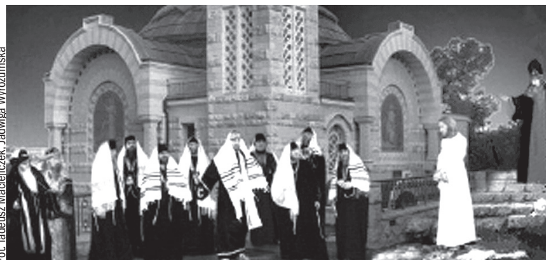
Sąd nocą u Kajfasza. Fotomontaż: scena z cieszyńskiego przedstawienia „Misterium Męki Pańskiej” na tle świątyni zbudowanej w Jerozolimie w miejscu, gdzie przed dwoma tysiącami lat rzeczywiście stał pałac Kajfasza.

(Zaczerpnięto z pracy Jana Szymika „Doroczne zwyczaje i obrzędy na Śląsku Cieszyńskim”.)