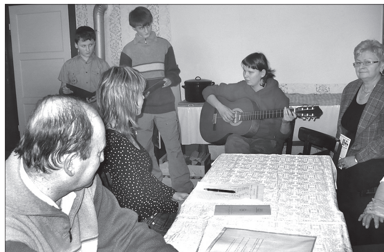
O program kulturalny na sejmiku w Rzece zadbały dzieci z gnojnickiej PSP