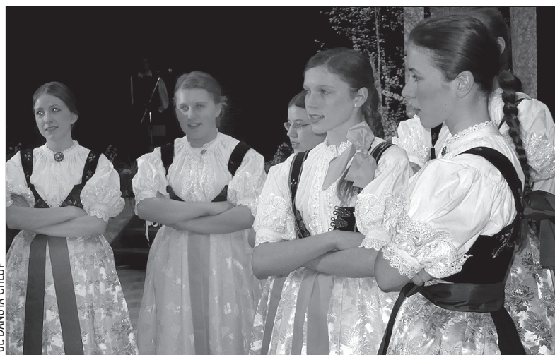
Mieszkańcy Hawierzowa, którzy zawitali w sobotę na jarmark wielkanocny do Domu Towarzystwa „Reneta”, z zainteresowaniem obejrzyli występy zespołów „Mali Błędowianie” i „Błędowianie”. Młodszy tancerze przedstawili dziecięce zabawy ludowe oraz tańce śląskie; ich starsi koledzy m. in. stawianie „moja”.