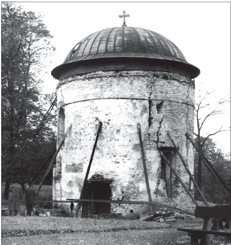
Tak wyglądała rotunda w latach 40. ubiegłego wieku.