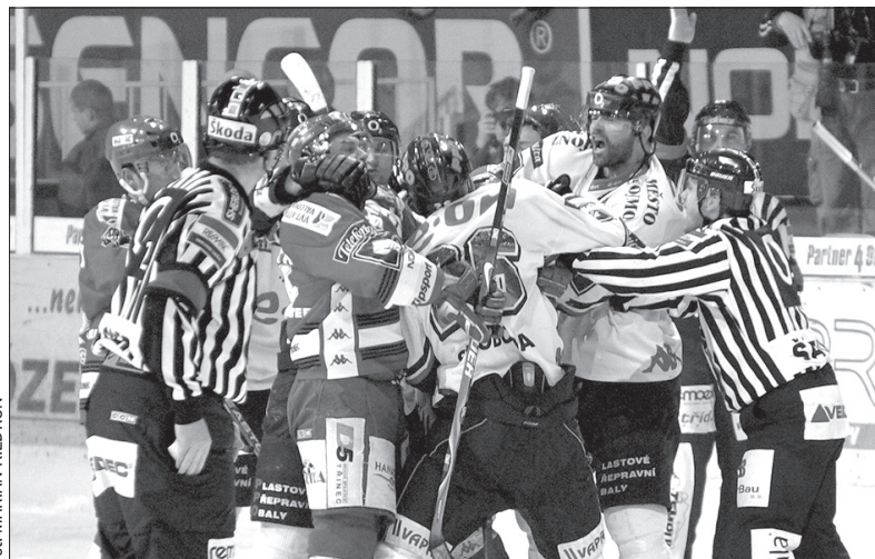
W niedzielę w trzynieckiej Werk Arenie zrobiło się niczym na gali boksu zawodowego.