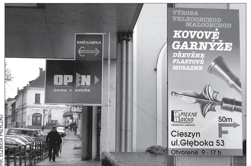
Takie dwujęzyczne napisy są już oczywistością wśród polskich firm starających się pozyskać klientów z Czech.

Zainteresowanie polskich firm rynkiem czeskim wynika także ze spraw czysto logistycznych – rynek ten znajduje się przecież bardzo blisko, do tego dochodzi bliskość kulturowa i brak większych problemów z porozumieniem się. Przedsiębiorcy, decydujący się nie tylko na oferowanie swoich usług w Czechach, ale i na otwarcie tutaj działalności gospodarczej, chwalą sobie bardziej stabilne