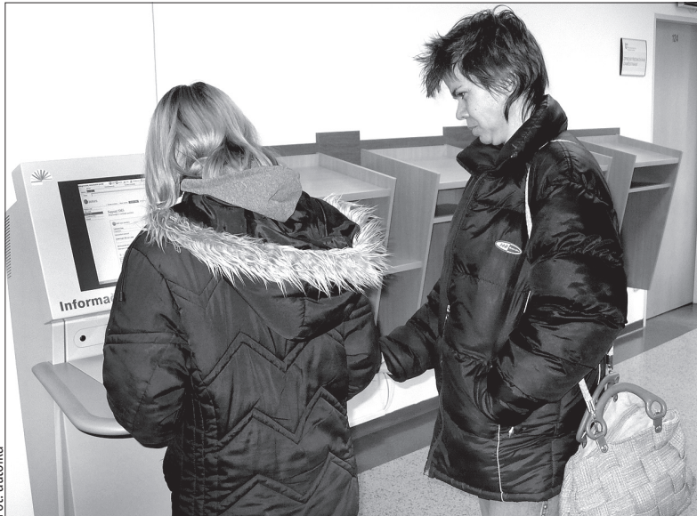
Wszystkim zainteresowanym służą w urzędach pracy tzw. infoboksy, czyli komputery, na których można bezpłatnie szukać w Internecie ofert pracy.

Dobrze radzi sobie działająca w karwińskiej strefie przemysłowej firma „Mölnlycke”, rozpoczynając też działalność nowe firmy, takie jak koreańska firma produkująca części dla fabryki „Hyundai”, niemniej nie można powiedzieć, że przyrost miejsc pracy jest główną zasługą stref przemysłowych. Nowe miejsca powstają w różnych sektorach, np. w usługach, w handlu (są to np. nowe supermarkety). Firmom i przedsiębiorcom powodzi się lepiej