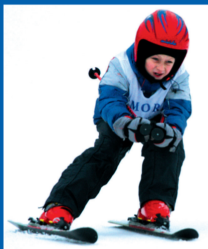
Młodzi chłopcy na trasie slalomu.