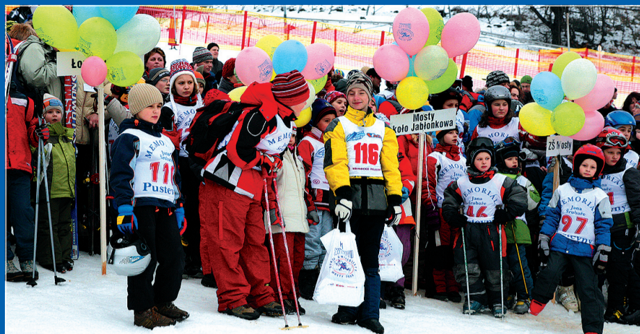
Inauguracja 37. Zjazdu Gwiazdzistego