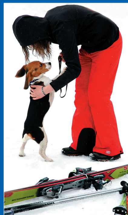
I po zawodach... pora rozgrzać wiernego kibica.