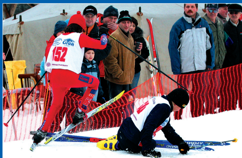
Ostre wiraże niektórym zawodnikom sprawiały niemałe kłopoty.