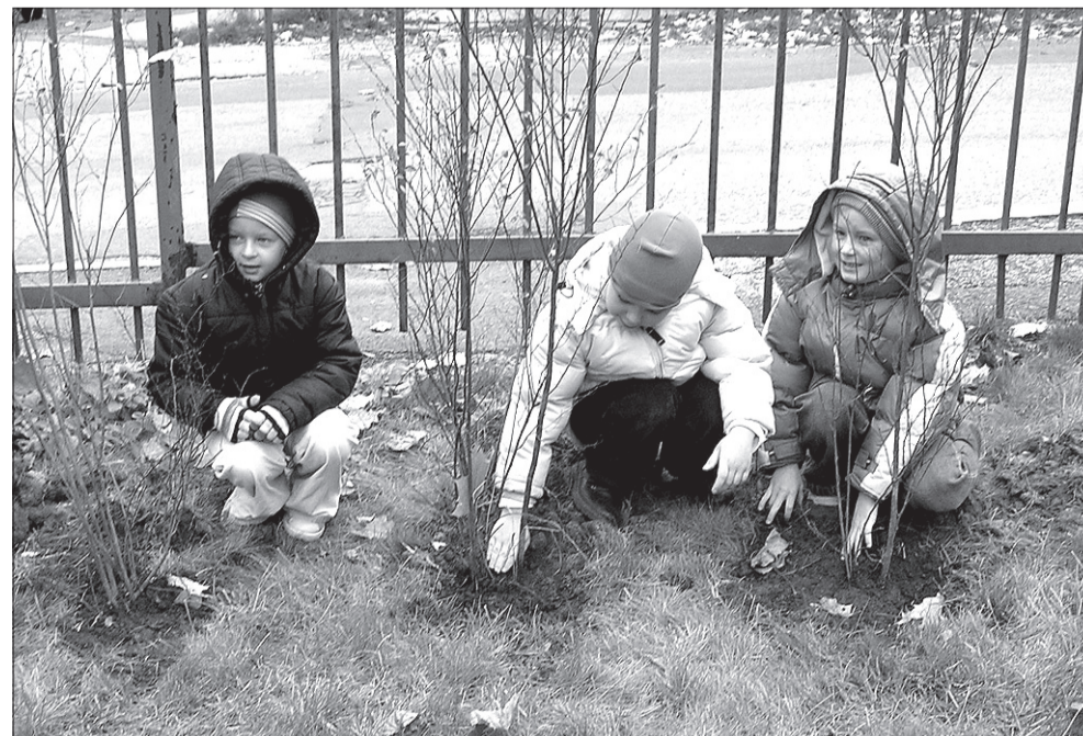
Pierwszoklasiści sadzą „swoje” drzewka w szkolnym ogrodzie.

Szkoła organizuje też zajęcia pozaszkolne?