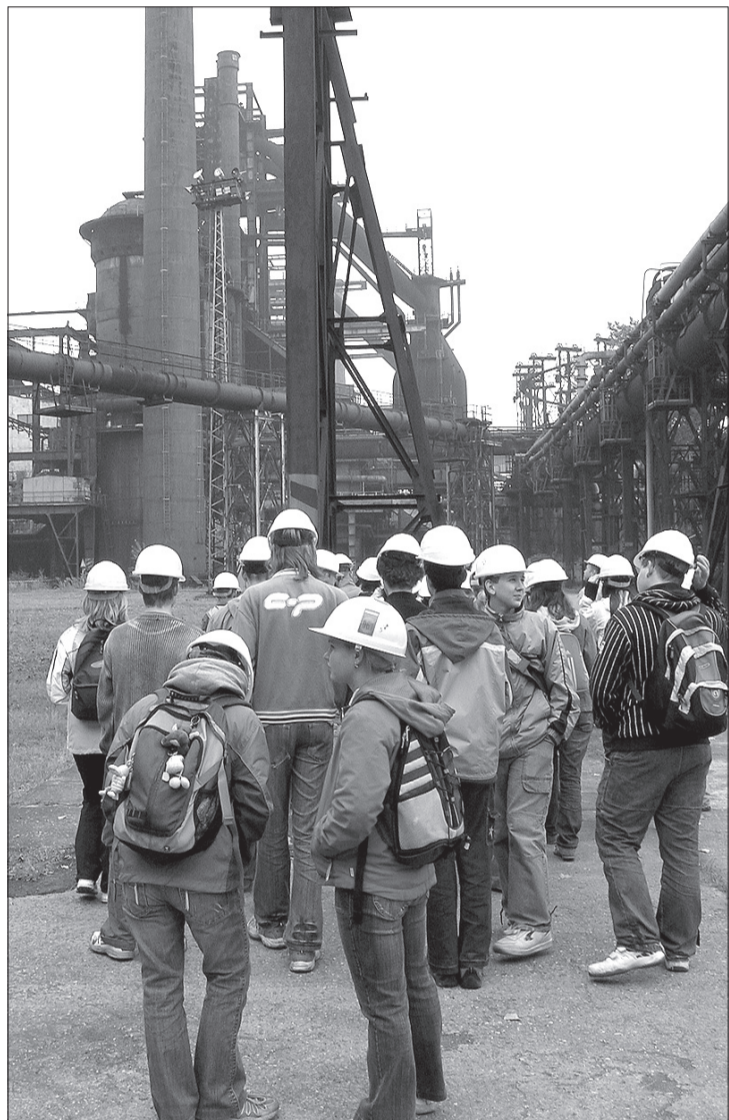
W ramach projektu „Poznajemy Śląsk Cieszyński” uczniowie zwiedzili m.in. wysokie piece w Witkowicach.

Każdy człowiek inaczej patrzy na różne sprawy, ma inne priorytety, na pewno więc do jakichś zmian dojdzie. Nie przewiduję jednak żadnych gwałtownych „szarpnięć sterem”. Wiele zmian będzie związanych z wdraża-