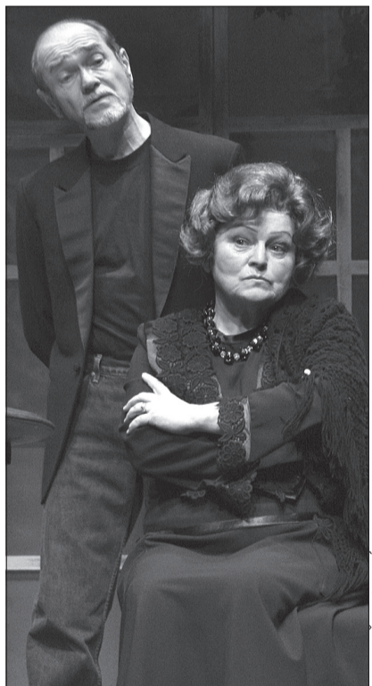
Fot. KATERINA CZERNA