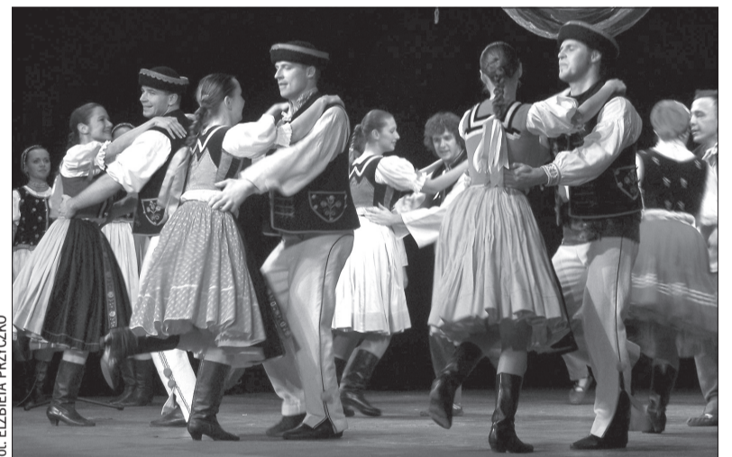
Na Przeglądzie Kapel Ludowych oraz Zespołów Folklorystycznych, który w tym roku miał miejsce w Trisli, wystąpił m.in. zespół „Żeleziar” z Koszyc.

Po ponad dwóch godzinach wspaniałego koncertu zespoły oraz kapale pojechały wraz z gośćmi do Mostów koło Jablonkowa. Przygotowane autokary zawiozły ich pod Dom PZKO, w którym około godziny 19.30 rozpoczął się 30. Bal Gorolski. Zabawę tradycyjnie rozpoczęto od tańca „chodzonego”. Potem tańczono poleczki, walczyki, ale i szybkie tańce słowackie, do tańca przygrywały bowiem zaproszone na przegląd kapale. Dużą część nocy upłynęła więc pod znakiem muzyki słowackiej. Balowicze w tradycyjnych strojach ludowych bawili się do rana, zmęczeni tańcem mogli zaś skosztować tradycyjnych placzków lub golonki i oczywiście mioduli.