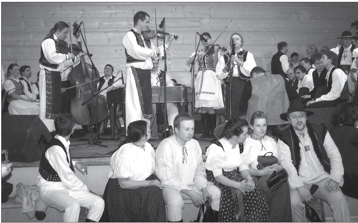
Do tańca grały balowiczom zaproszone kapele. Na zdjęciu kapela „Friš”, która na balu ochrzciła swoją nową płytę CD.