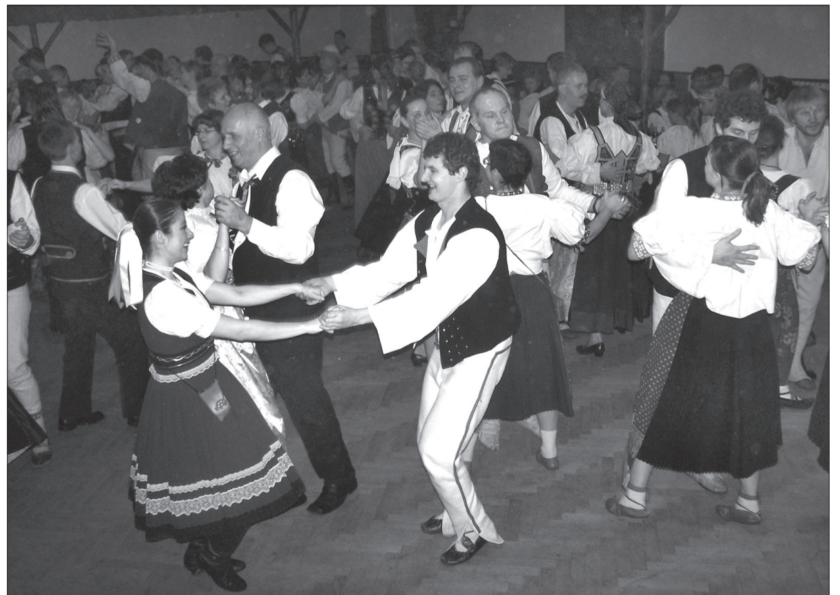
Miłośnicy folkloru w strojach ludowych bawili się do rana przy muzyce polskich, czeskich i słowackich kapel.