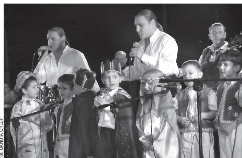
Dzieci z polskiego przedszkola w Suchej Górnej zaśpiewały razem z „Golcami” koledę „Przybieżeli do Betlejem”.