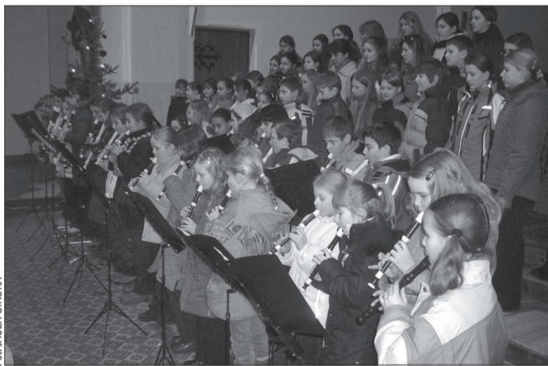
Na sobotnim koncercie w czeskokocieszyńskim kościele katolickim chóry „Trallala” i „Trallalinki” zaśpiewały wspólnie z zespołem flecistów „Skowronki”.