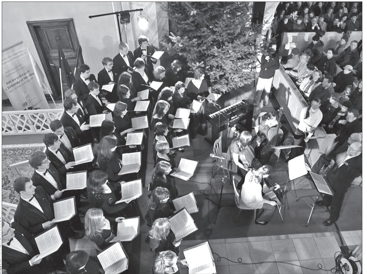
Chór „Canticum Novum” zaśpiewał na koncercie także kolędy.

– Cieszę się z tego zaproszenia. Już samo śpiewanie w kościele to dla każdego wokalisty niesamowite przeżycie, bo każda świątynia ma wspaniałą akustykę. Dla mnie ważne jest to, że mogę zaśpiewać na koncercie w kościele, w którym przed dziewięć laty przystępowa-