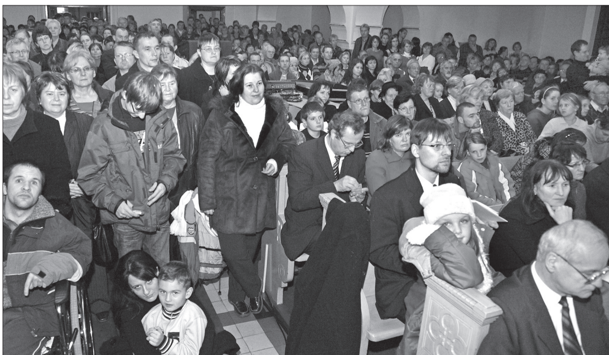
Kościół Na Niwach w niedzielę pękał w szwach.