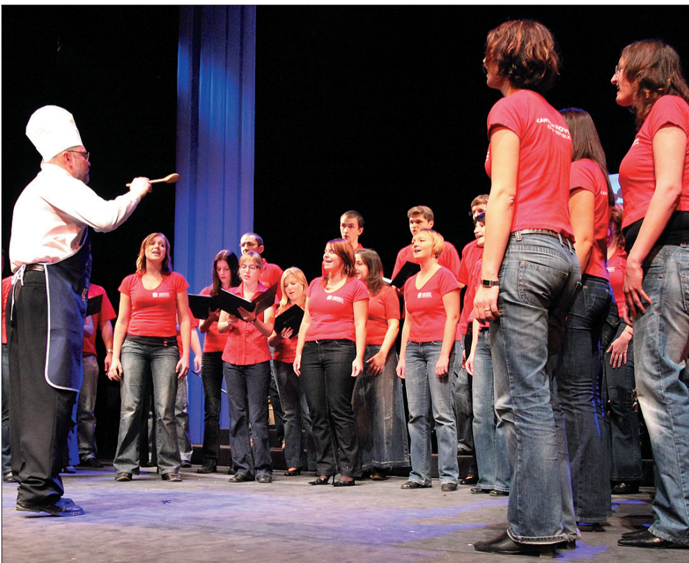
„Canticum Novum”, czyli muzyka ze smakiem.