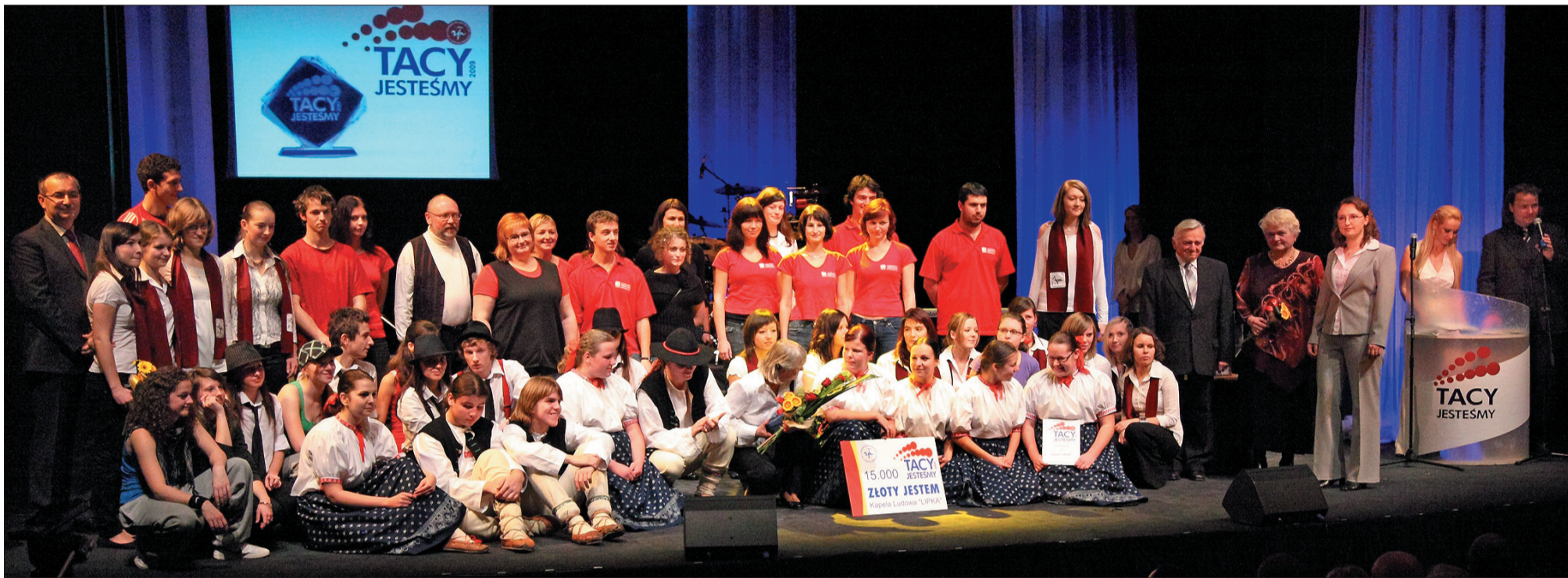
Laureaci plebiscytu pozują do pamiątkowego zdjęcia na deskach teatru.

W sobotnie popołudnie ściągających do Teatru Cieszyńskiego gości wiata muzyką kapela ludowa Lipka. Muzykanci nie wiedzieli wtedy jeszcze, że wygrali plebiscyt „Tacy jesteście”. Dowiedzieli się chwilę później, podczas gali. Do zespołu młodych muzyków z Jabłonkowa, działającego przy tamtejszej Podstawowej Szkole Artystycznej, trafiła statuetka „Złoty jestem 2009” i czek na 15 tys. koron.