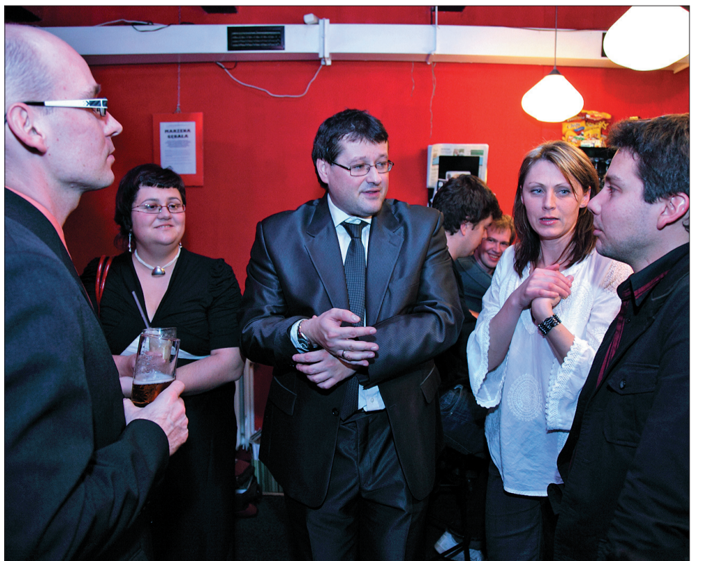
Wieczór zakończył się w klubie „Dziupla”, już w nieoficjalnej atmosferze.