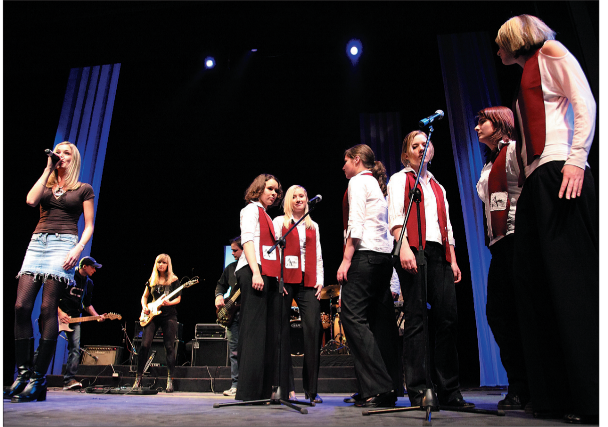
„Testament mój” Juliusza Słowackiego w wykonaniu grupy rockowej Glazyzy i zespołu wokalnego Alaudae.