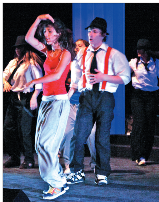
Na scenie gimnazjalny taneczny zespół Dance 4 Fun.