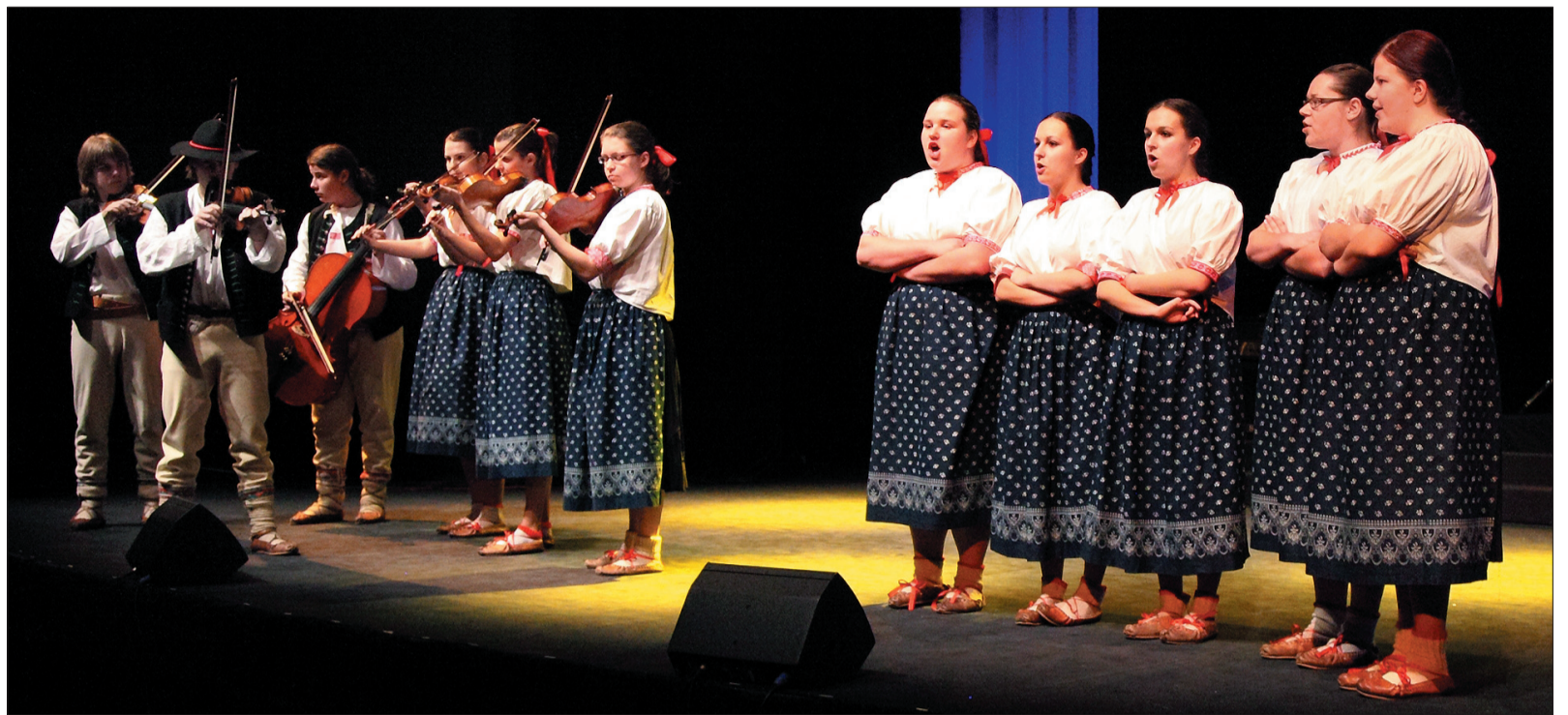
Na podium zwycięzca „Lipka”, która wróci do Jabłonkowa z nagrodą 15 tys. koron.