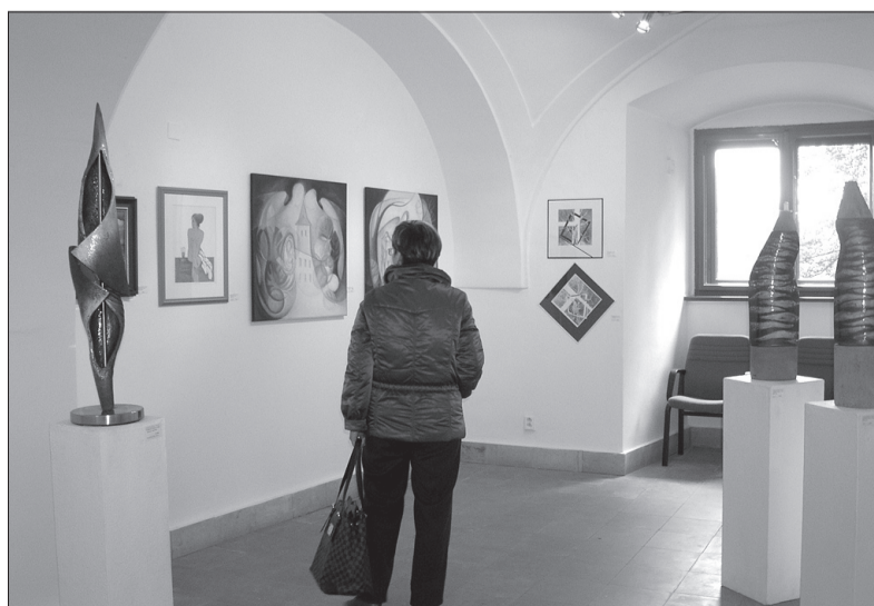
Fragment ekspozycji w Galerii Zamkowej „Chagall”.

Wystawę we frysztańskiej Galerii Zamkowej „Chagall” oglądać możemy – oprócz poniedziałków – codziennie w godz. 9-18, do 8 listopada. (o)