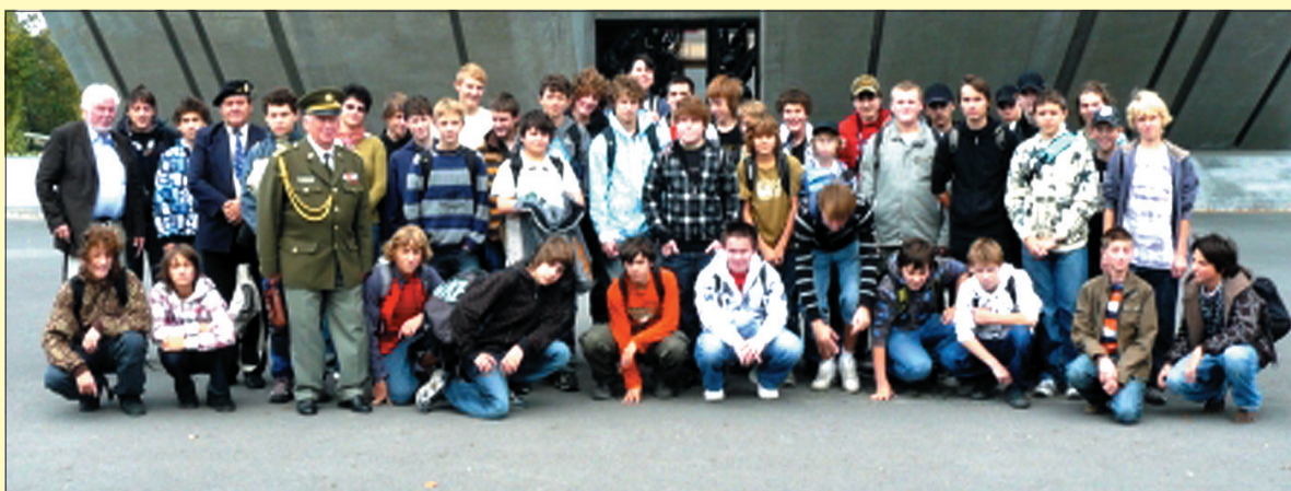
Dziewiątklasiści na wycieczce w Muzeum II Wojny Światowej.