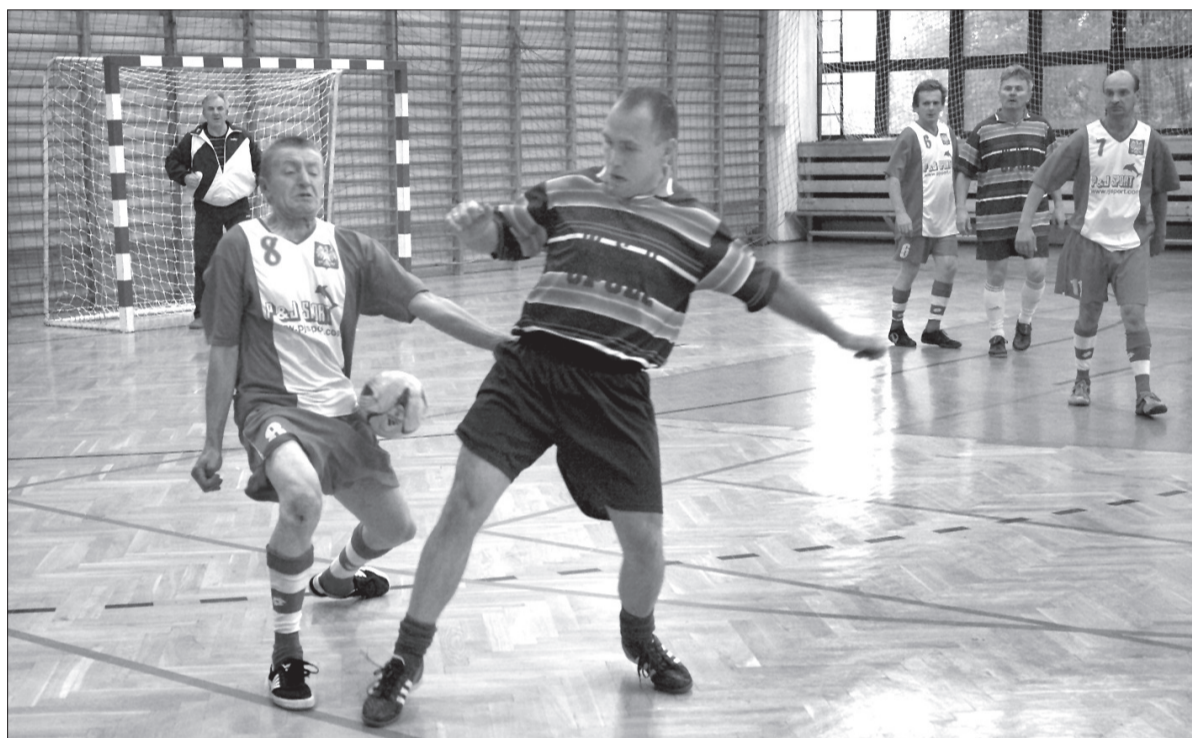
W ramach Festiwalu Sztuki Bezdomnej odbył się turniej piłki nożnej.