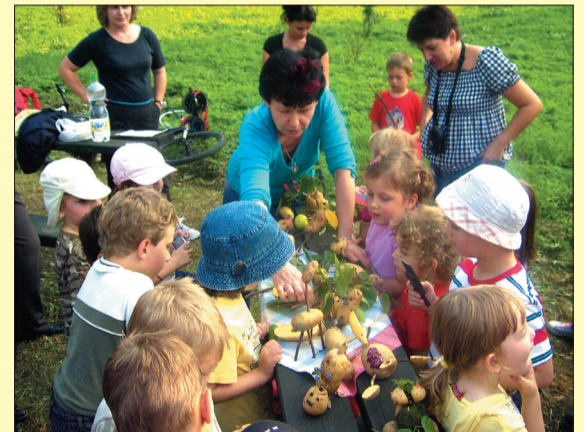
Przedszkolaki, ich rodzice, nauczycielki oraz wykonane wspólnie cudaki-ziemniaki.

Natomiast w piątek 16 października rodzice spotkali się na tradycyjnym wieczorku zapoznawczym w Czytelnicy. Przy smacznej kolacji, ciastkach pani Farnej oraz kanapkach zapoznali się ze sobą. Bawili