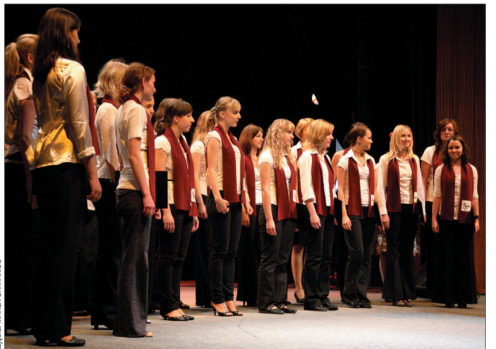
Glayzy są nominowane do nagrody „Tacy jesteśmy” po raz trzeci. Tym razem zespół pojawi się na koncercie galowym wspólnie z chórem „Alaudae”.