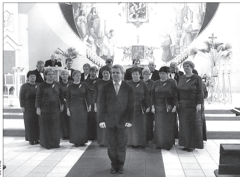
Chór mieszany „Dźwięk” śpiewał w kościele w Pogorzu.