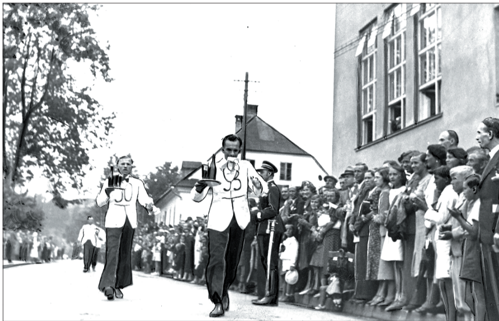
Pierwszy bieg kelnerów w Wiśle odbył się jeszcze przed II wojną światową.