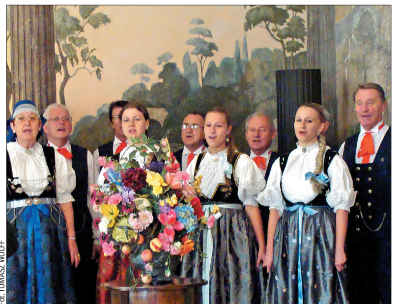
Estrada Ludowa „Czantoria” została nagrodzona za upowszechnianie kultury.

śniactwo” chodzić w stroju cieszyńskim. A my jesteśmy z tego dumne, nie przejmujemy się docinkami – przyznają zgodnie.