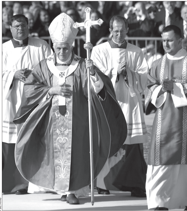
Papież Benedykt XVI w Brnie.