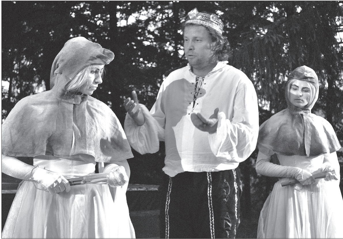
„Makbet” w plenerze, czyli koniec sezonu Sceny Polskiej w Koszarzyskach.

Tym razem zakończenie sezonu przyciągnęło do Koszarzysk mniej widzów niż w poprzednich latach. Powodem była pogoda i notka w „Głosie Ludu”, w której kierownictwo Sceny zapowiadało, że w razie deszczu przedstawienie może się nie odbyć. – W przyszłości musimy się zastanowić, jak w razie niepogody chronić publiczność i aktorów przed deszczem – powiedział nam kierownik ośrodka Pasieczki,