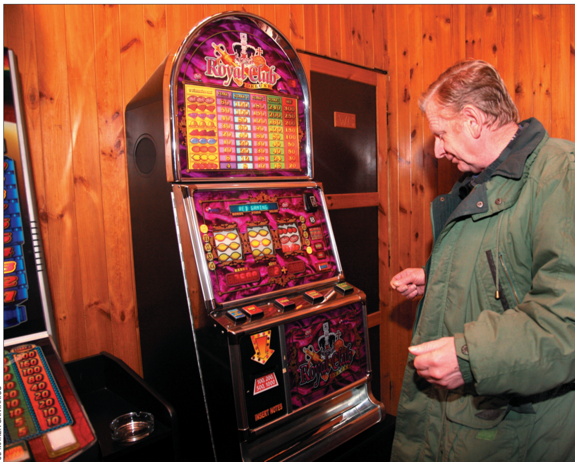
Automaty do hazardu dostępne są teraz niemal wszędzie.

– Klienci zawsze się znajdują. Przychodzą do nas grać też ludzie z Polski, bo po tamtej stronie nie ma zbyt wielu salonów, a w Czeskim Cieszynie