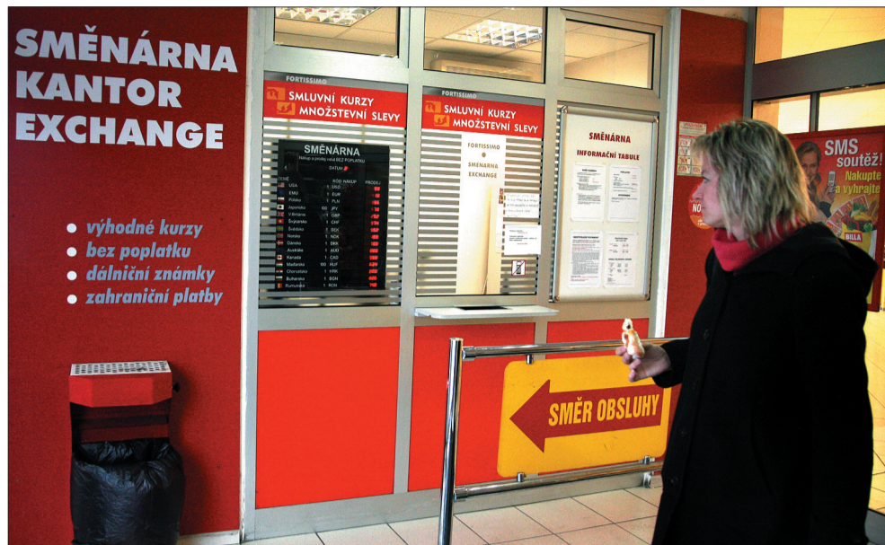
W Czeskim Cieszynie pierwszy kantor pojawił się w sierpniu 1996 roku w domu handlowym Billa.

W błędzie jest osoba, która myśli, że pojawienie się legalnych kantorów zupełnie zlikwidowało cinkciarzy. – W Cieszynie pojawiają się jeszcze, najczęściej w sobotę na targowisku i skupują korony. Ale to są marginalne przypadki, to amatorzy. Wiem, że w Czechach jest ich więcej. Słyszałem, że w tych większych miastach, na przykład w Ostrawie, jeszcze są. Czasami nawet na bezczelnego handlują przed drzwiami kantorów – opowiada syn właściciela kantoru przy ul. Zamkowej w Cieszynie. Nie chce ujawnić nazwiska. Ta branża nie kocha rozgłosu.