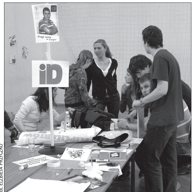
Setka uczniów z dwóch stron granicy wspólnie przygotowuje kampanie wyborcze do Parlamentu Europejskiego.