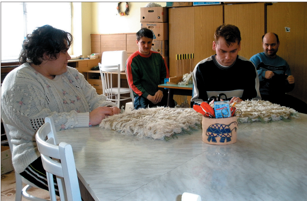
Klienci Centrum Dziennego „Eden” Diakonii Śląskiej w Czeskim Cieszynie biorą udział w różnych zajęciach terapeutycznych. Na zdjęciu: warsztaty tkackie.

Placówka „Diakonii Śląskiej” dla osób z upośledzeniem umysłowym lub kombinowanym. Liczba miejsc: 26. Całodobowy dom opieki, warsztaty terapeutyczne.