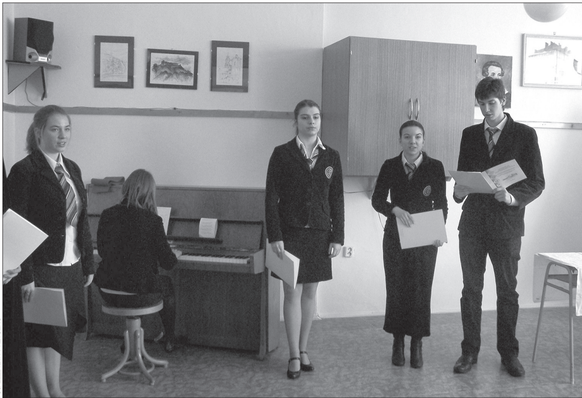
W czasie inauguracji zabrzmiały wiersze Słowackiego.