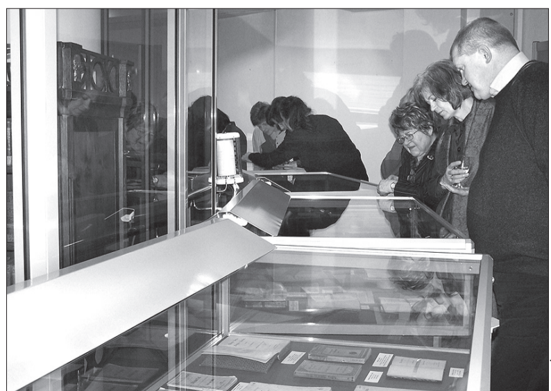
Wystawa w Książnicy Cieszyńskiej prezentuje lektury szkolne Polaków z lat 1850-1956.