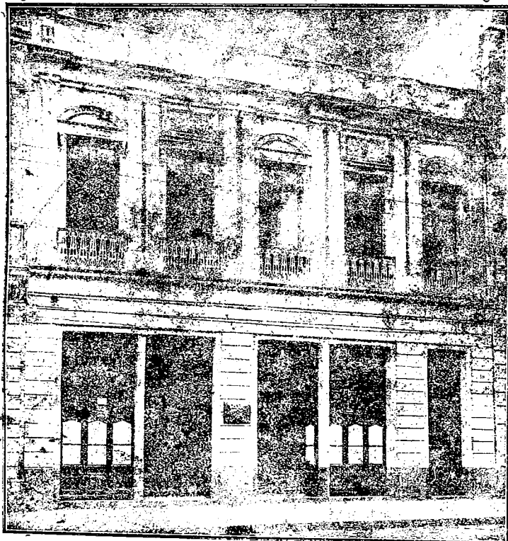
Siedziba filjalna w Kurytybie Rua 15 de Novembro 55