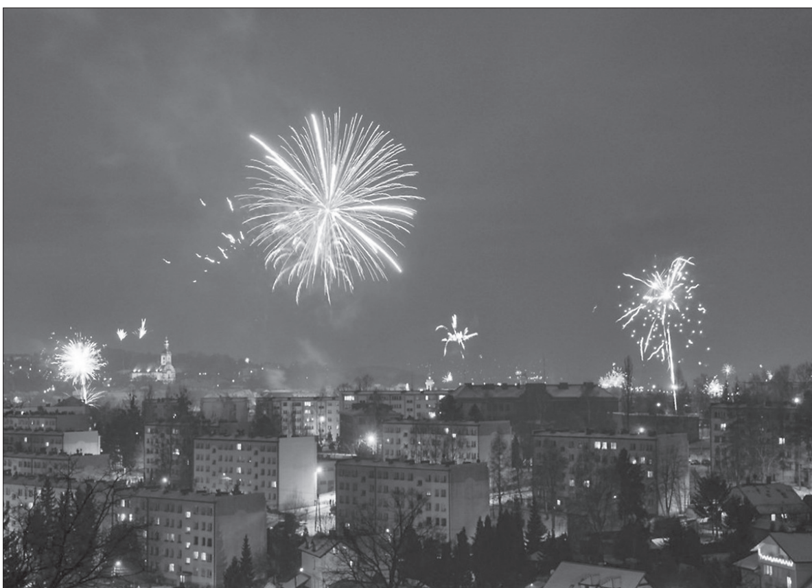
Sylwestrowe fajerwerki nad Śląskiem Cieszyńskim.

Również w Karwinie pokaz sztucznych ogni odbędzie się dopiero 1 stycznia. O godz. 18.30 zajaśnieją one nad frysztackim zamkiem. Miasto nie ogranicza jednak sylwestrowo-noworocznej oferty do